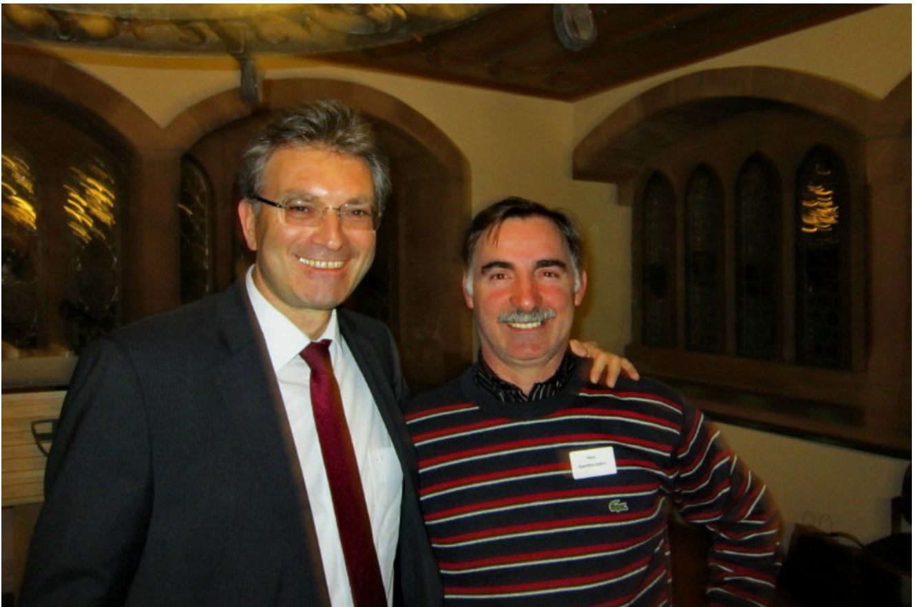
Бургомистр немецкого города Фрибург, член партии "зеленых"