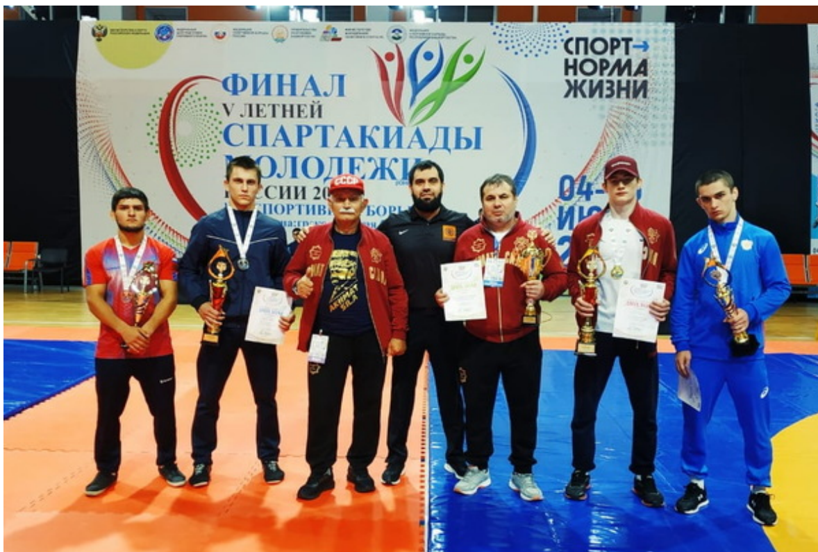
Делегация Чеченской Республики в Уфе