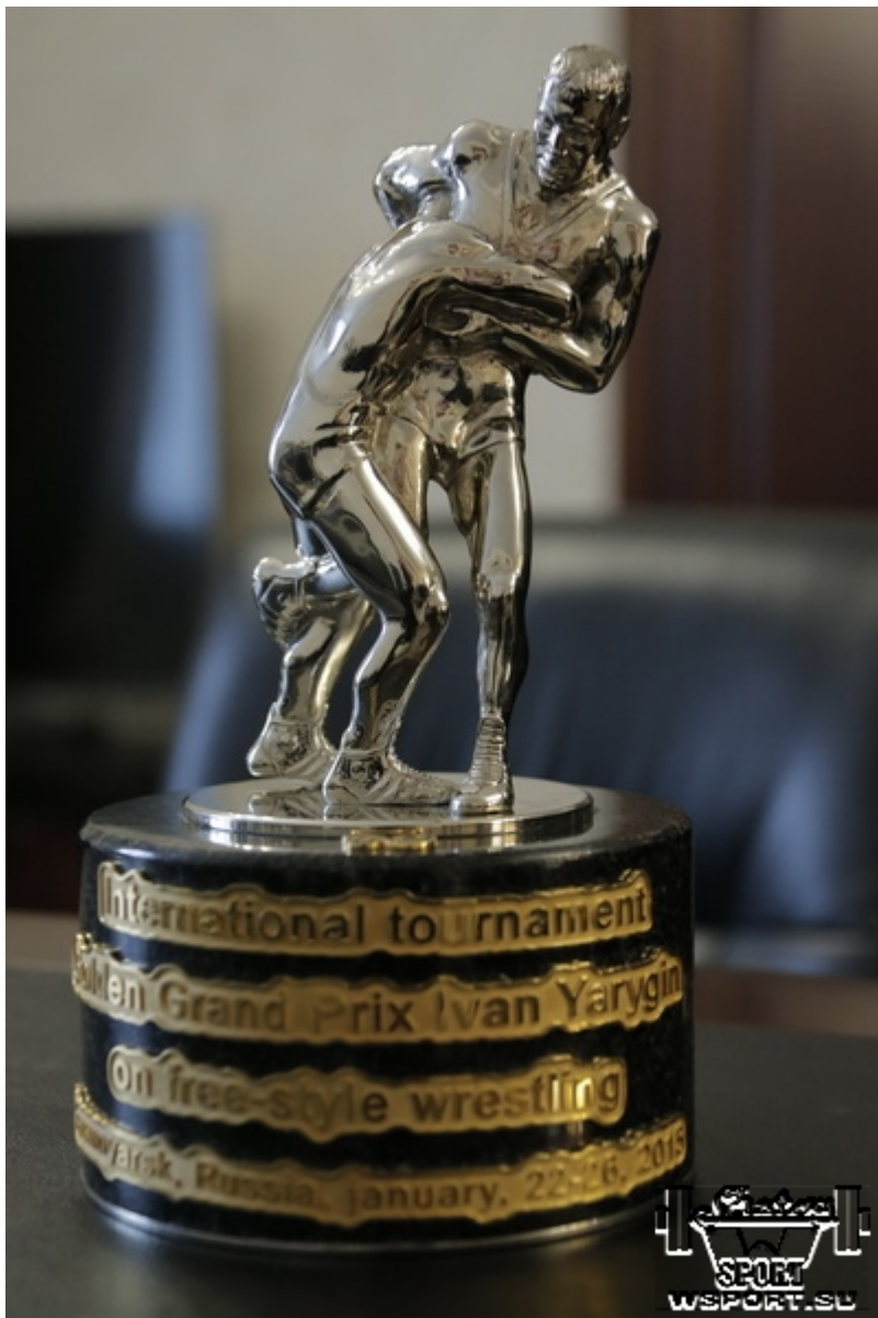
Кубок для чемпиона