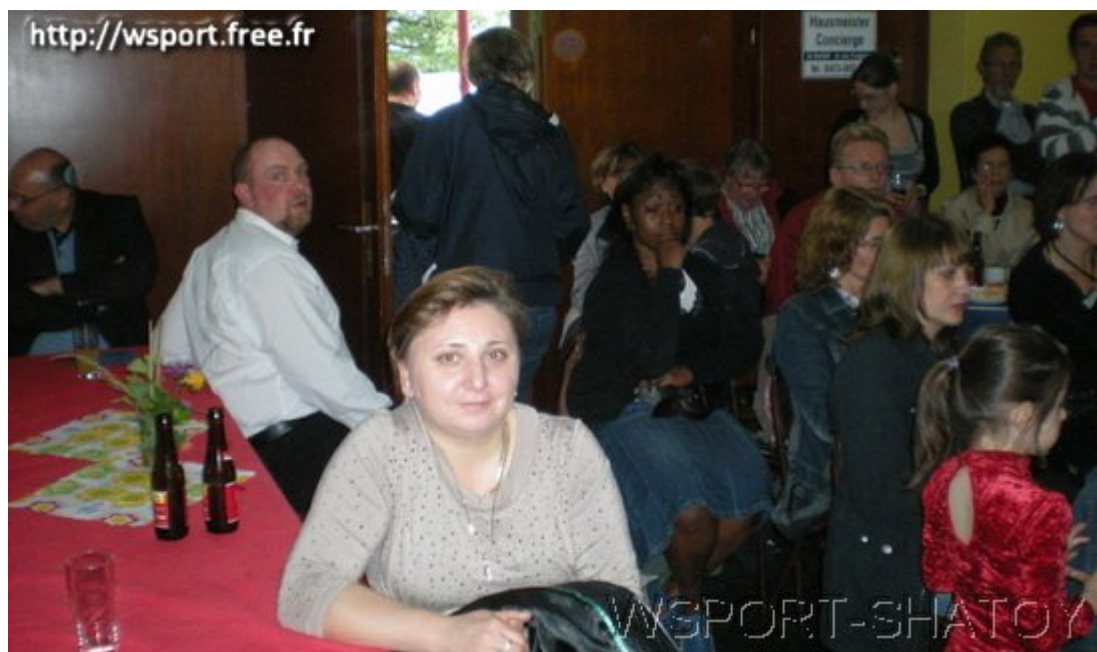
Мама переживает за девочек