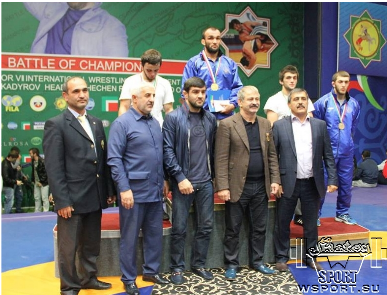
Награждение призеров категории 70 кг