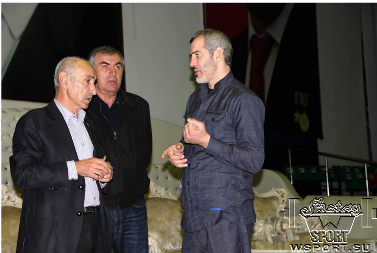
Решение последних оргвопросов