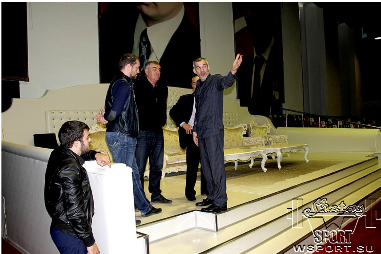
Решение последних оргвопросов