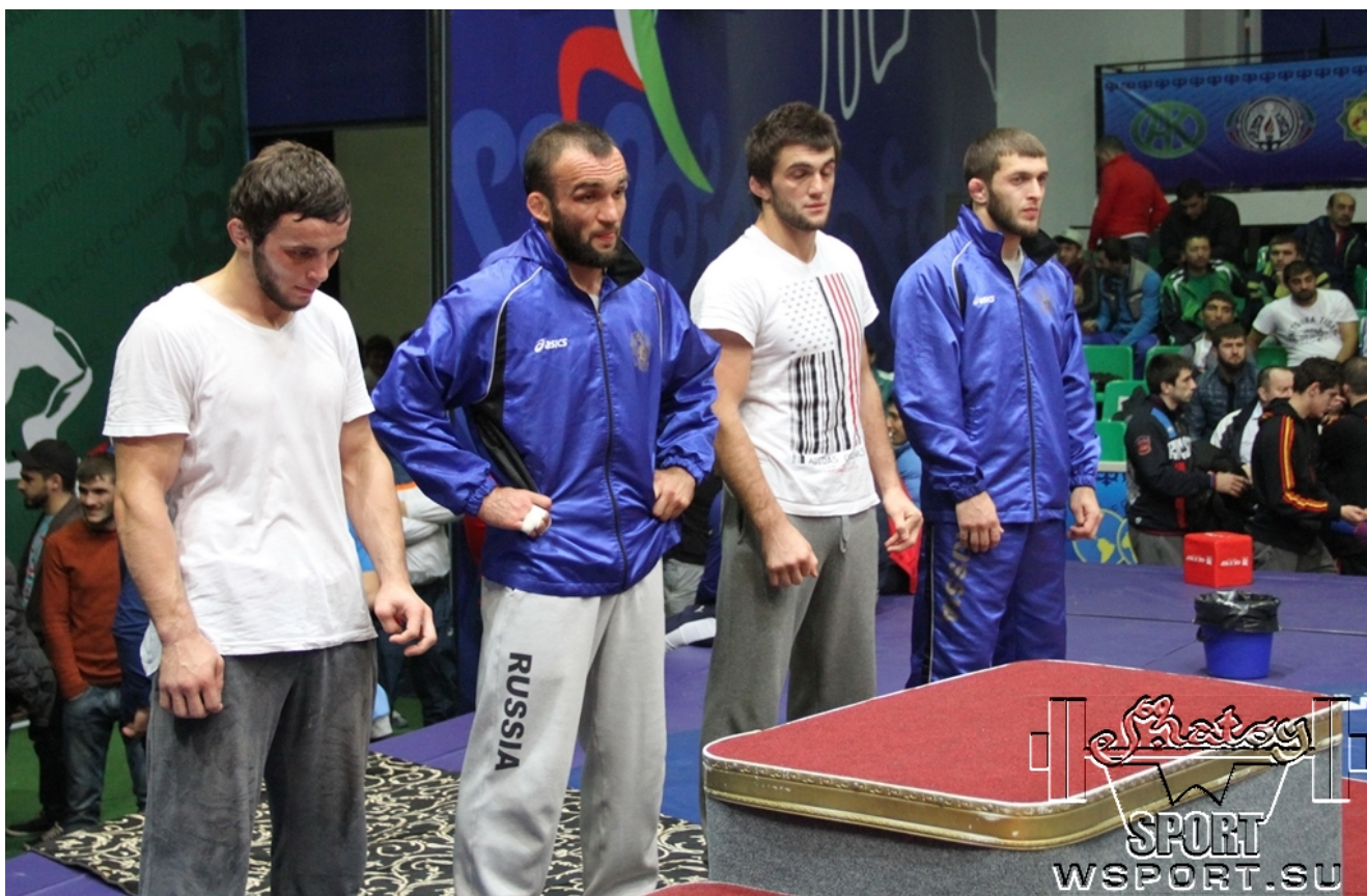
Награждение призеров категории 70 кг