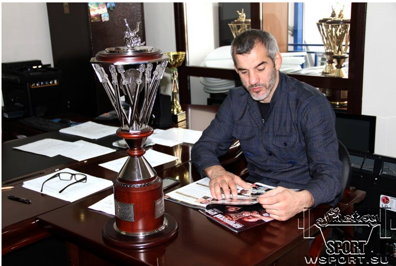
Бувайсар Сайтиев просматривает свежий номер журнала