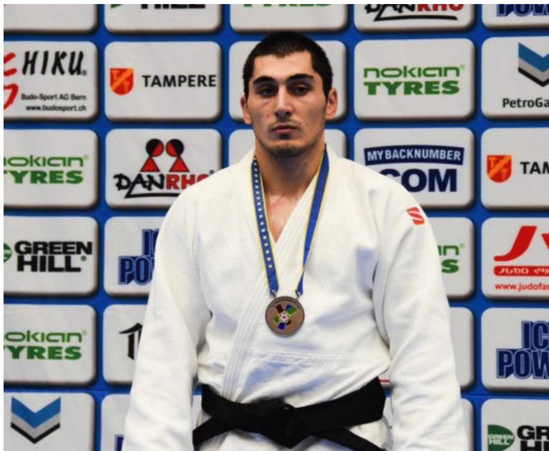
Зелимхан Башаев.