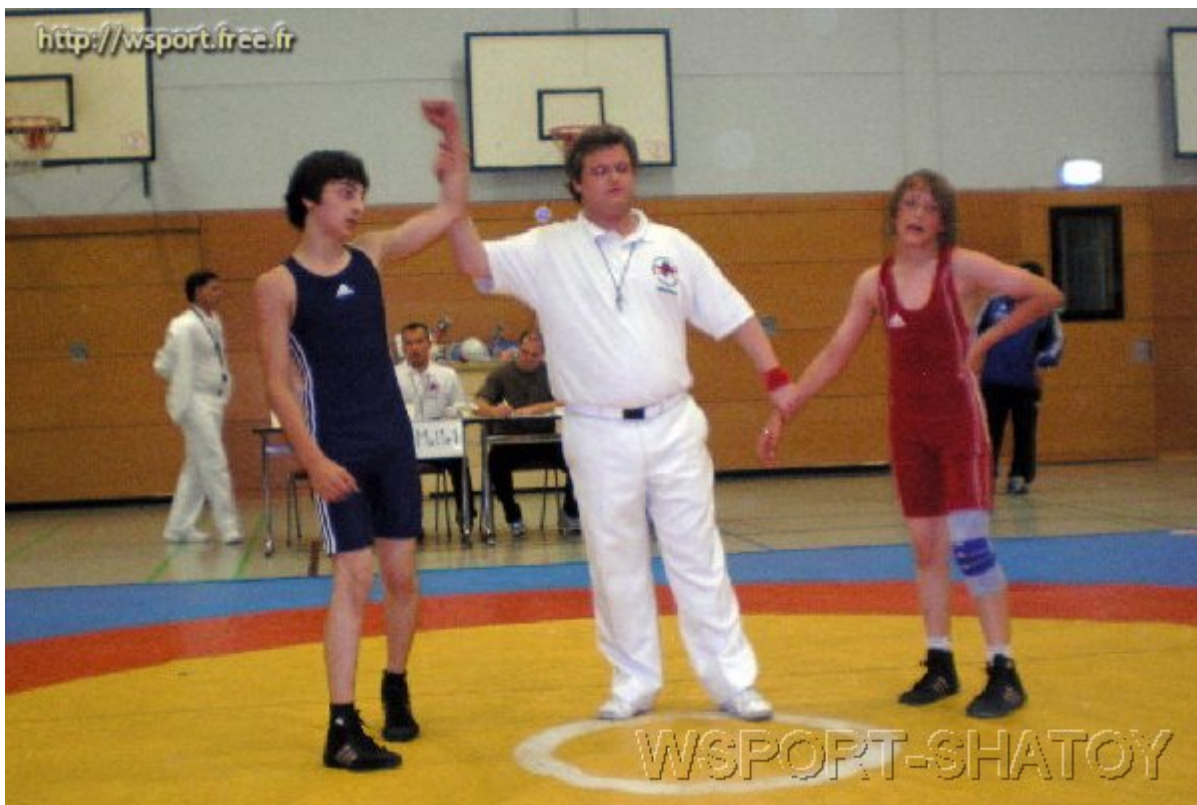
Джохар Гамбулатов выигрывает у Карстена Вегнера