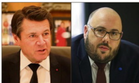
« Les 10 millions d'euros que nous donnons aux associations permettent à 70 000 licenciés de pratiquer leur activité », indique le maire.