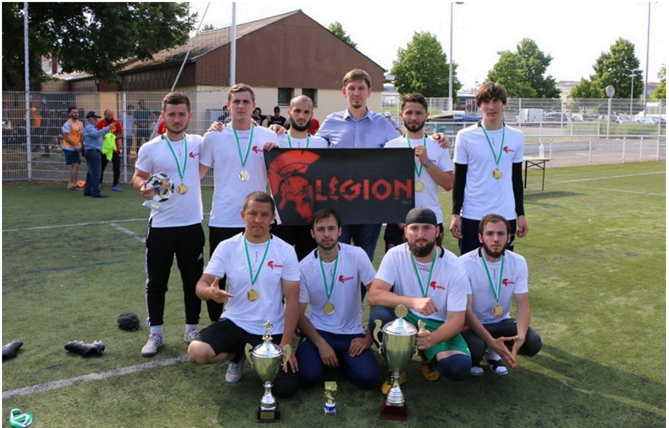
2-кратный победитель Кубка Франции - Мемориала Юсупа Темерханова среди вайнахов Легион - Ницца.