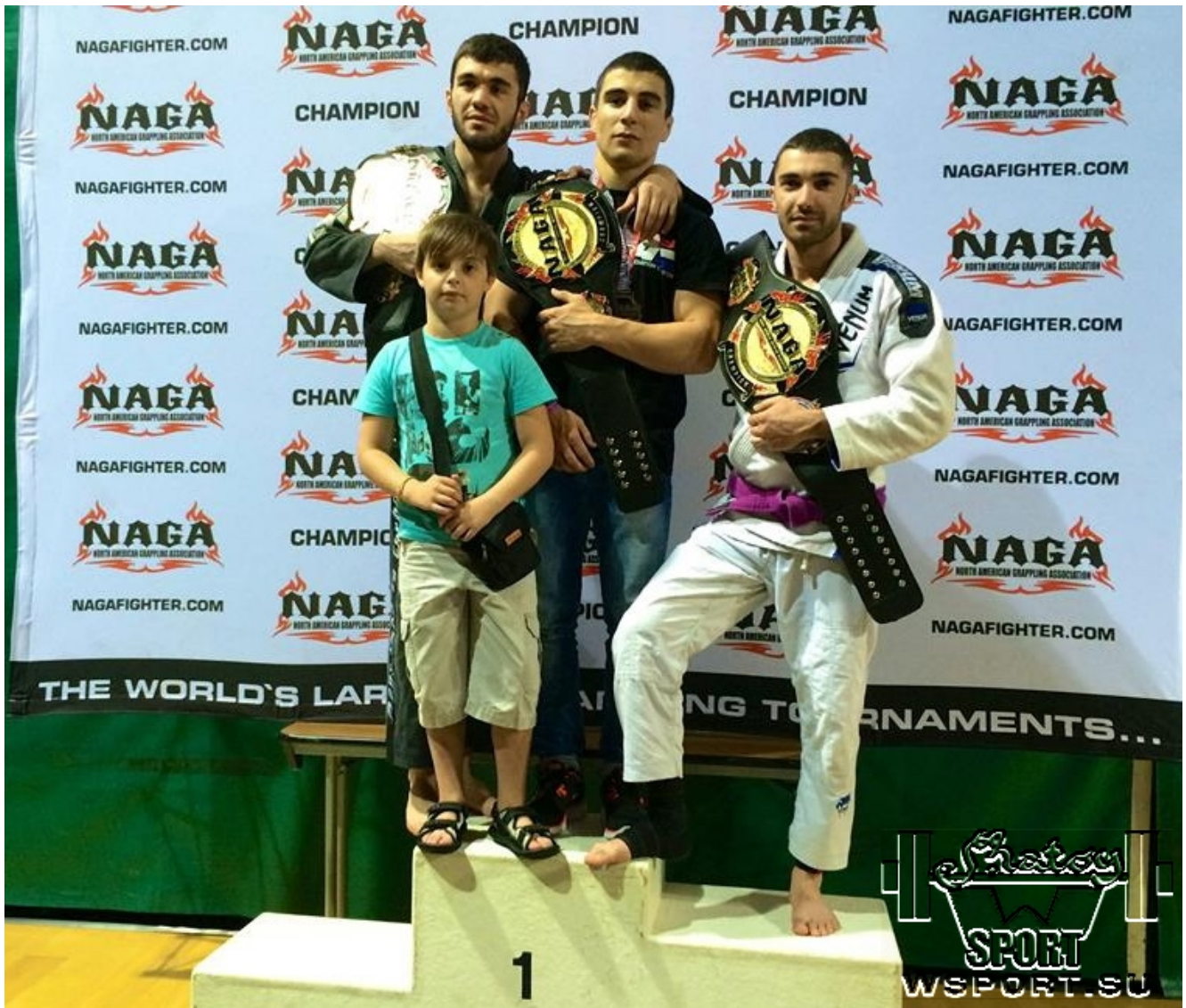
Чеченские обладатели чемпионских поясов.