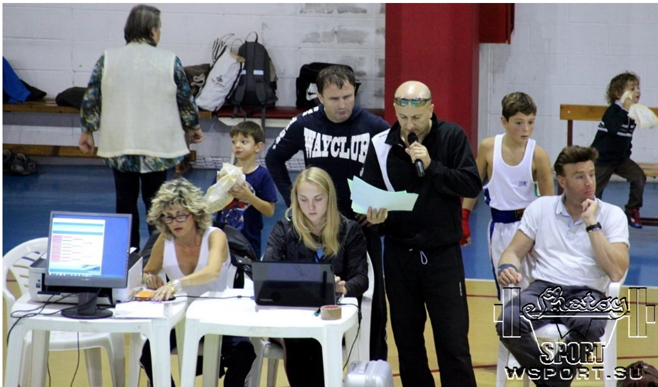
Объявляют спорное решение