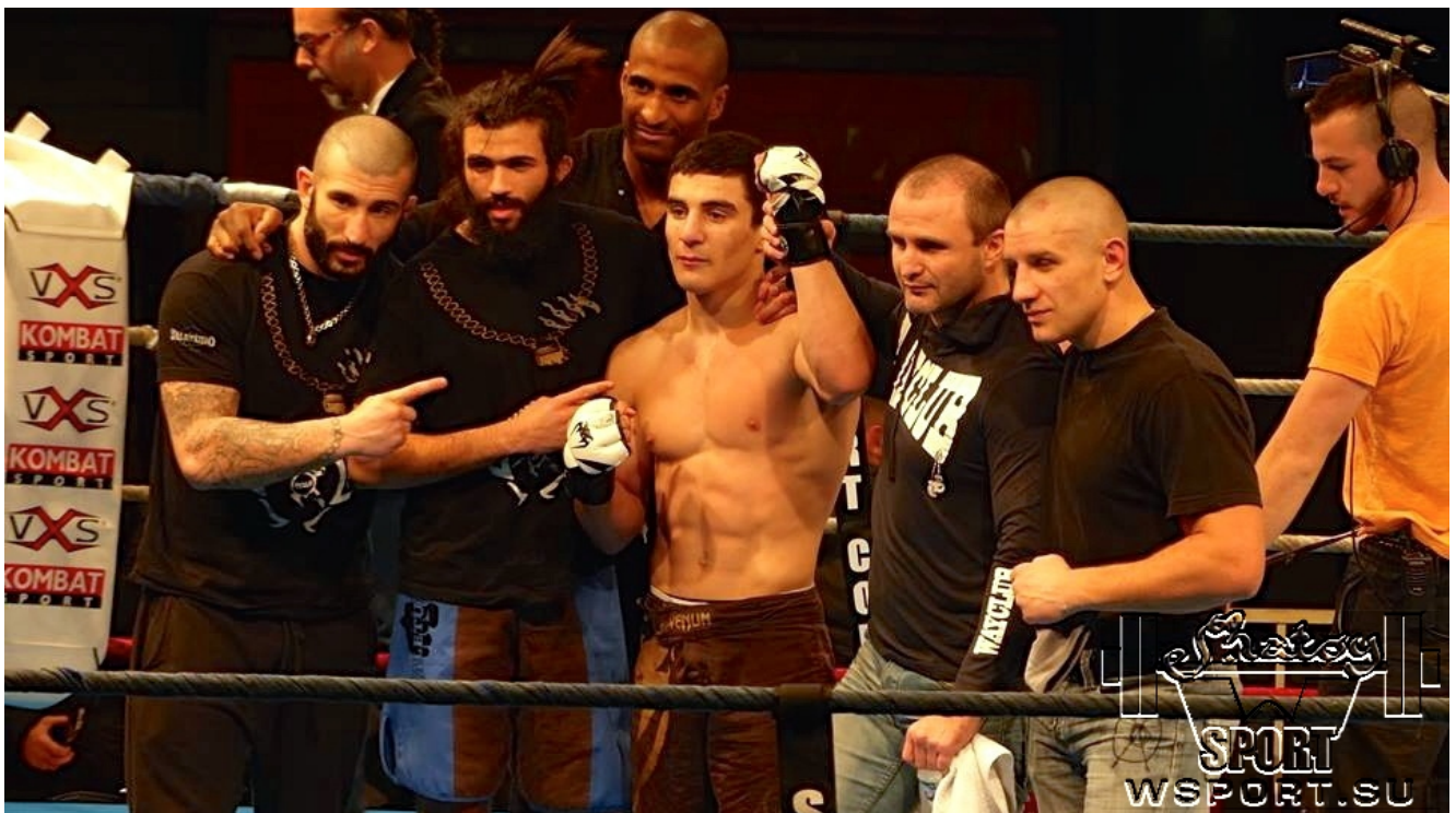
С командой Boxing Squad