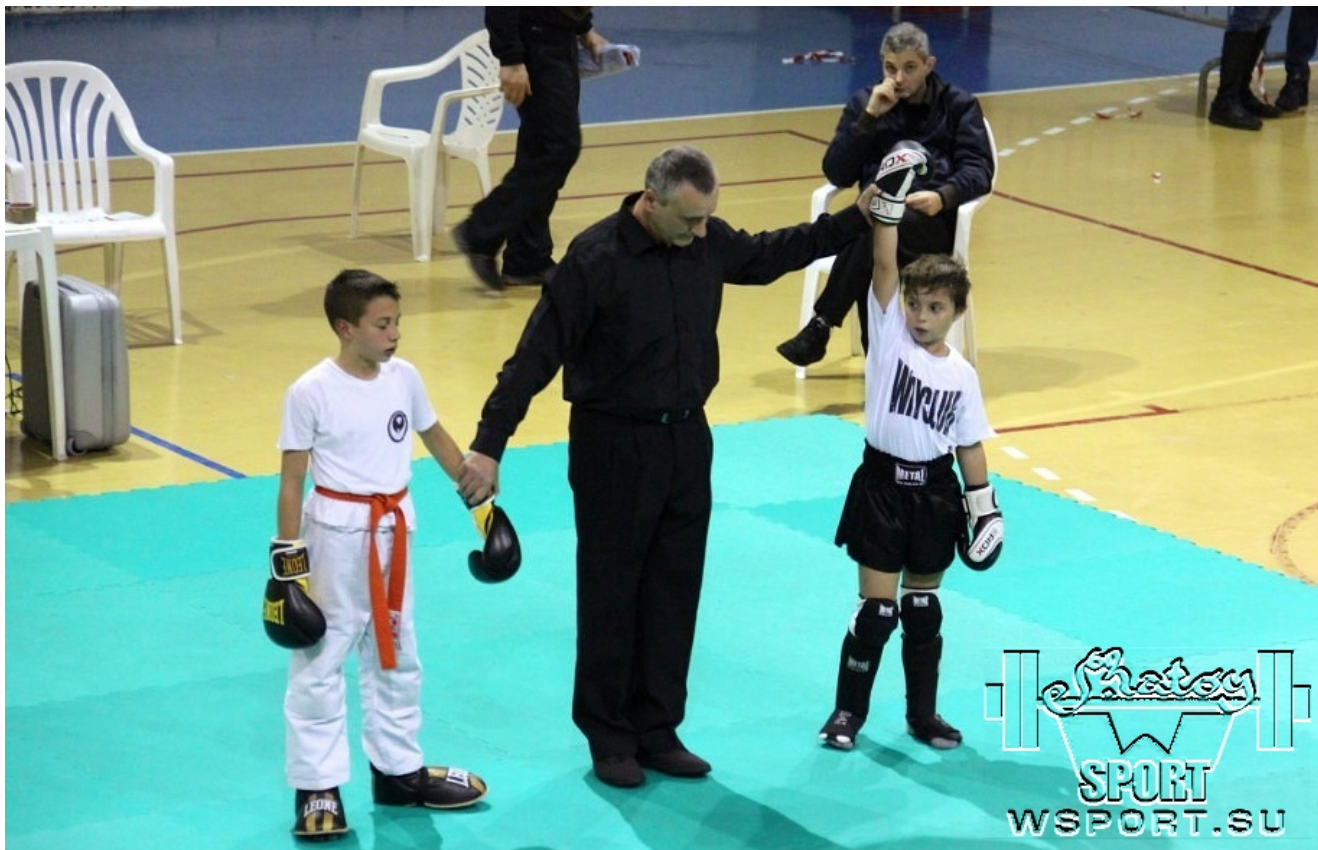
Есть победа и звание чемпиона