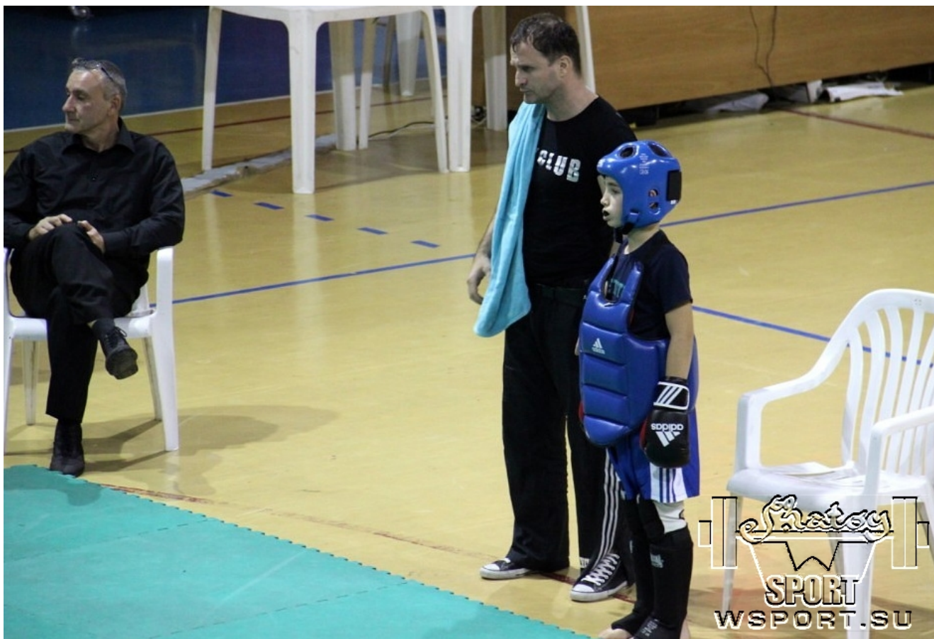
Султан к битве готов