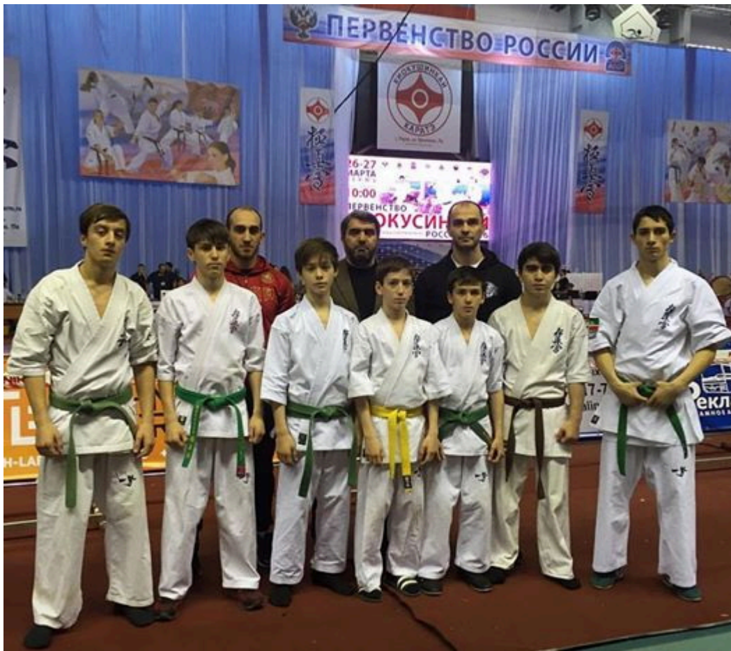
Команда Чеченской Республики в Перми