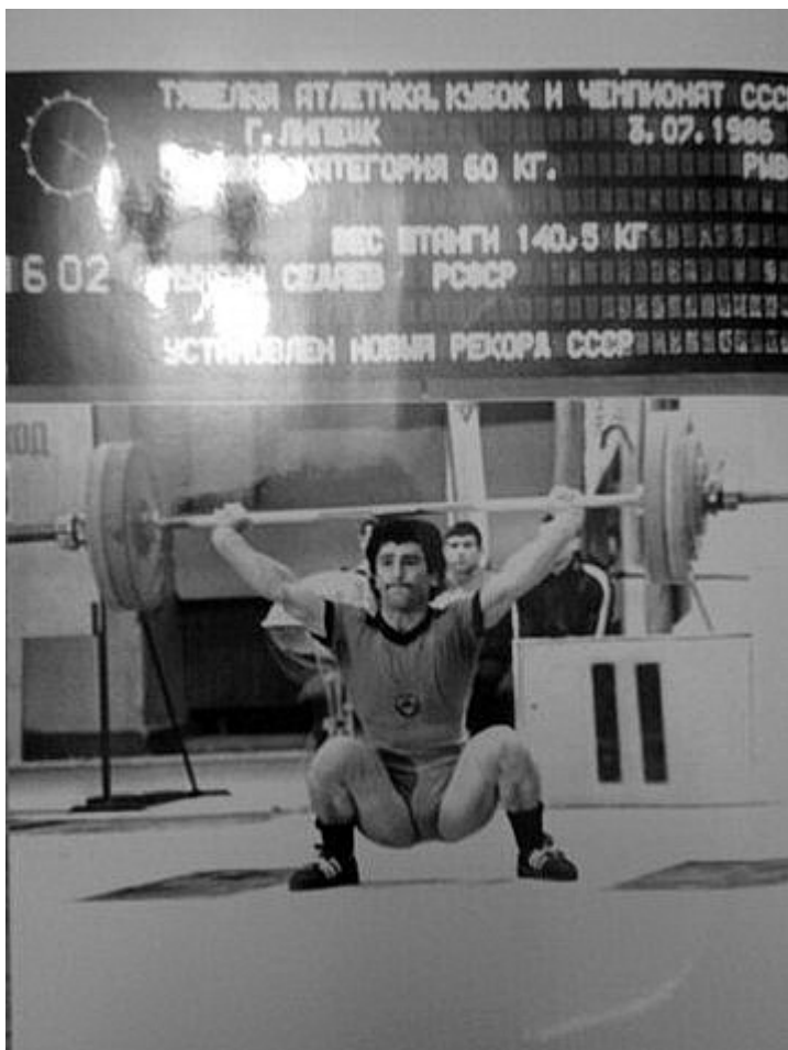
Мухади Седаев устанавливает рекорд СССР