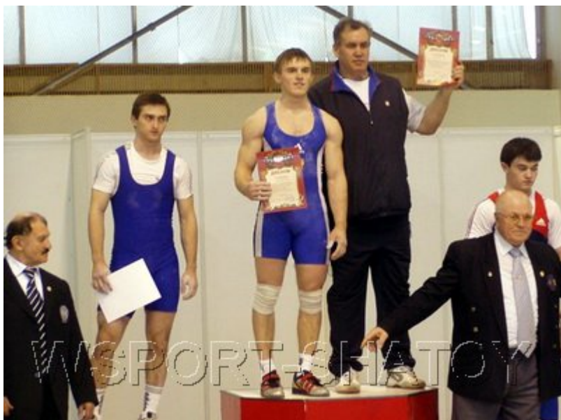
Серебро в первенстве России 2009 среди юношей