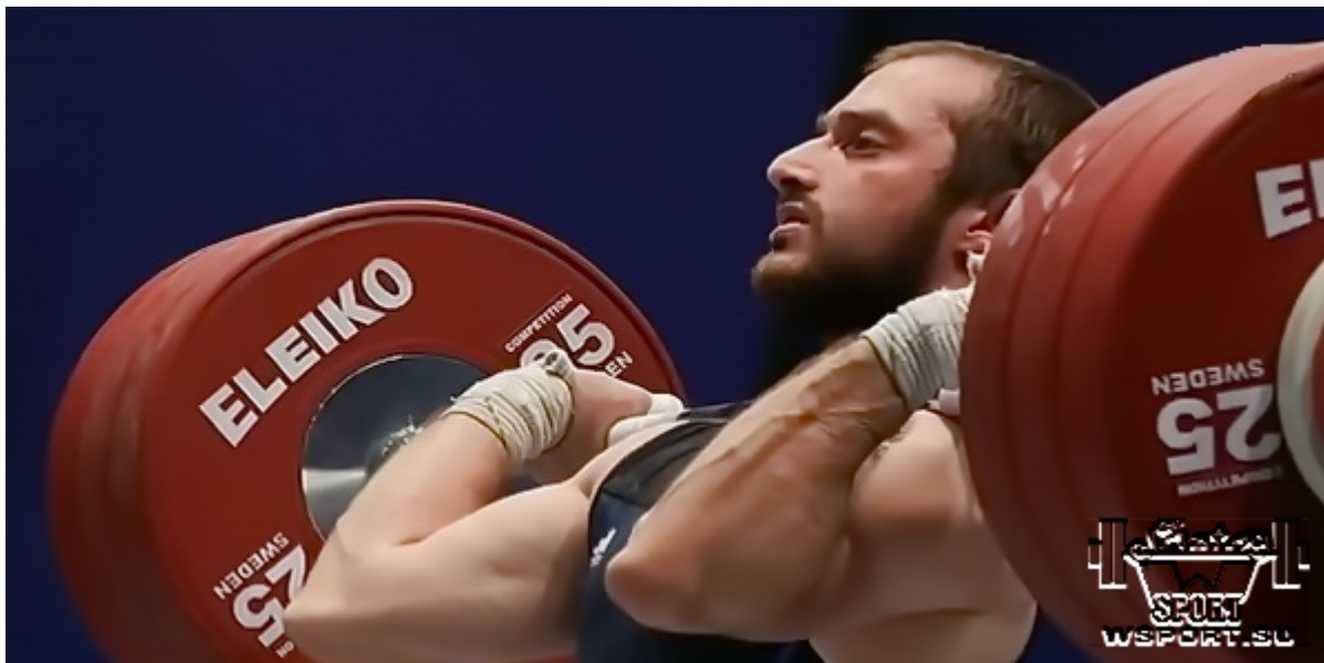
Чемпионат России-2014, Грозный.