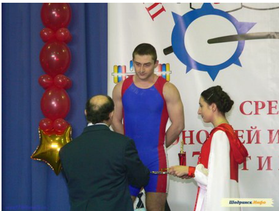
Серебро в первенстве России 2010 года среди юношей