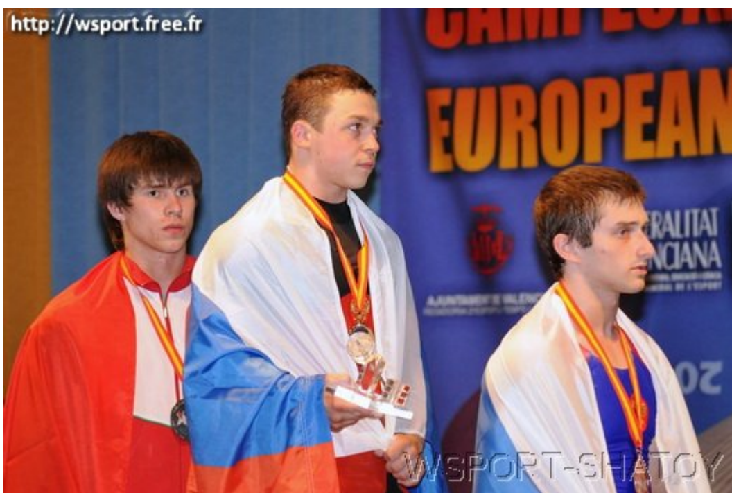
Первенство Европы 2010 среди юношей 17 лет, Валенсия-Испания