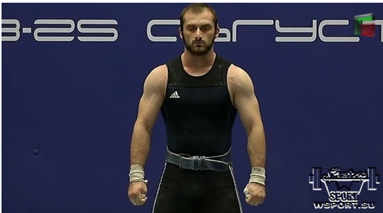
Чемпионат России-2014, Грозный.