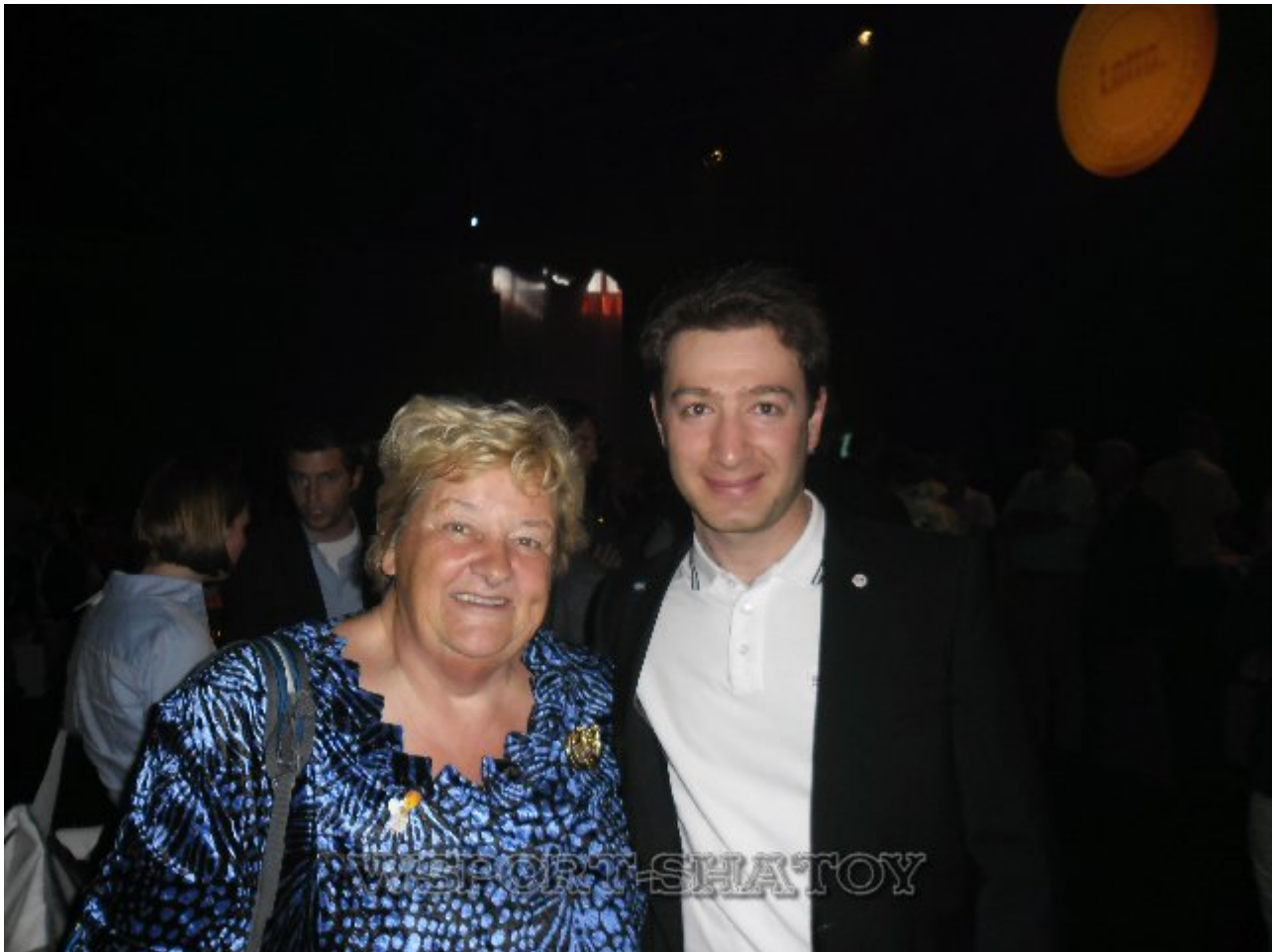
Эрика Терптстра, бывший президент Олимпийского комитета Голландии, серебряный и бронзовый призёр Олимпиады-1964 в Токио по плаванию