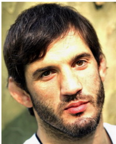
Бувайсар Сайтиев, вольная борьба