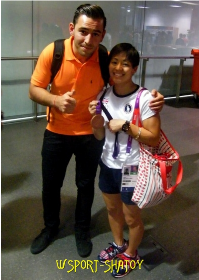
Бронзовая призерка Олимпиады Кларисса Чэнь (США)