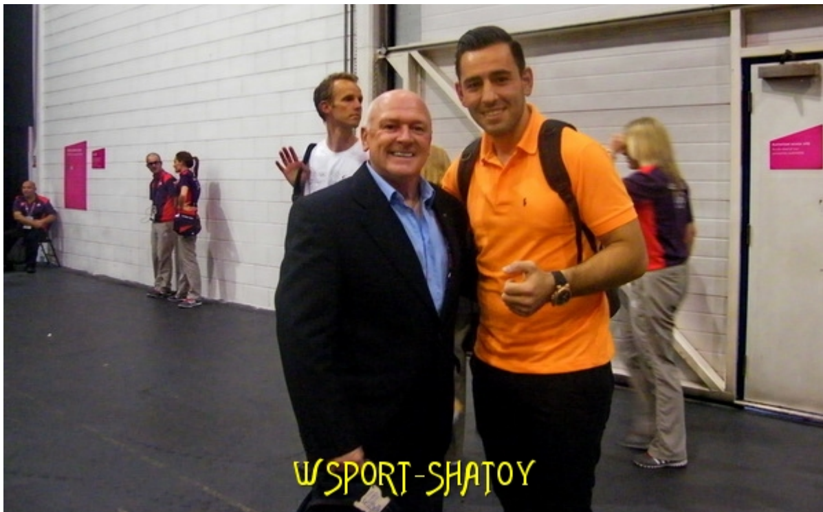
С телеведущим борцовских соревнований