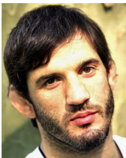
Бувайсар Сайтиев, вольная борьба