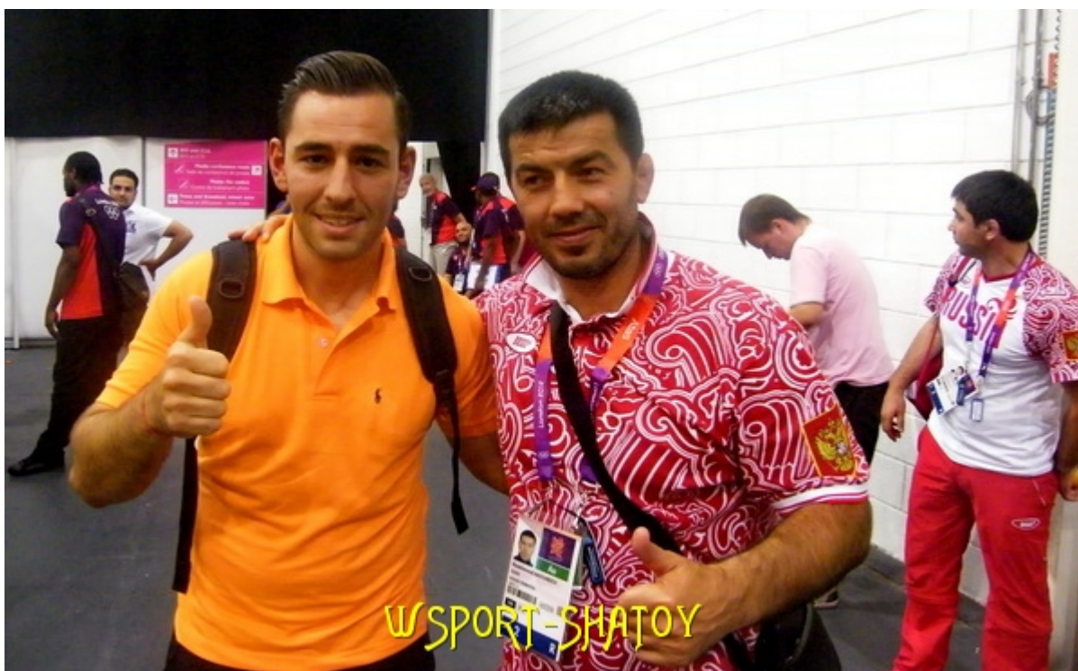
С тренером сборной России, олимпийским чемпионом Атланты-96 Хаджимурадом Магомедовым