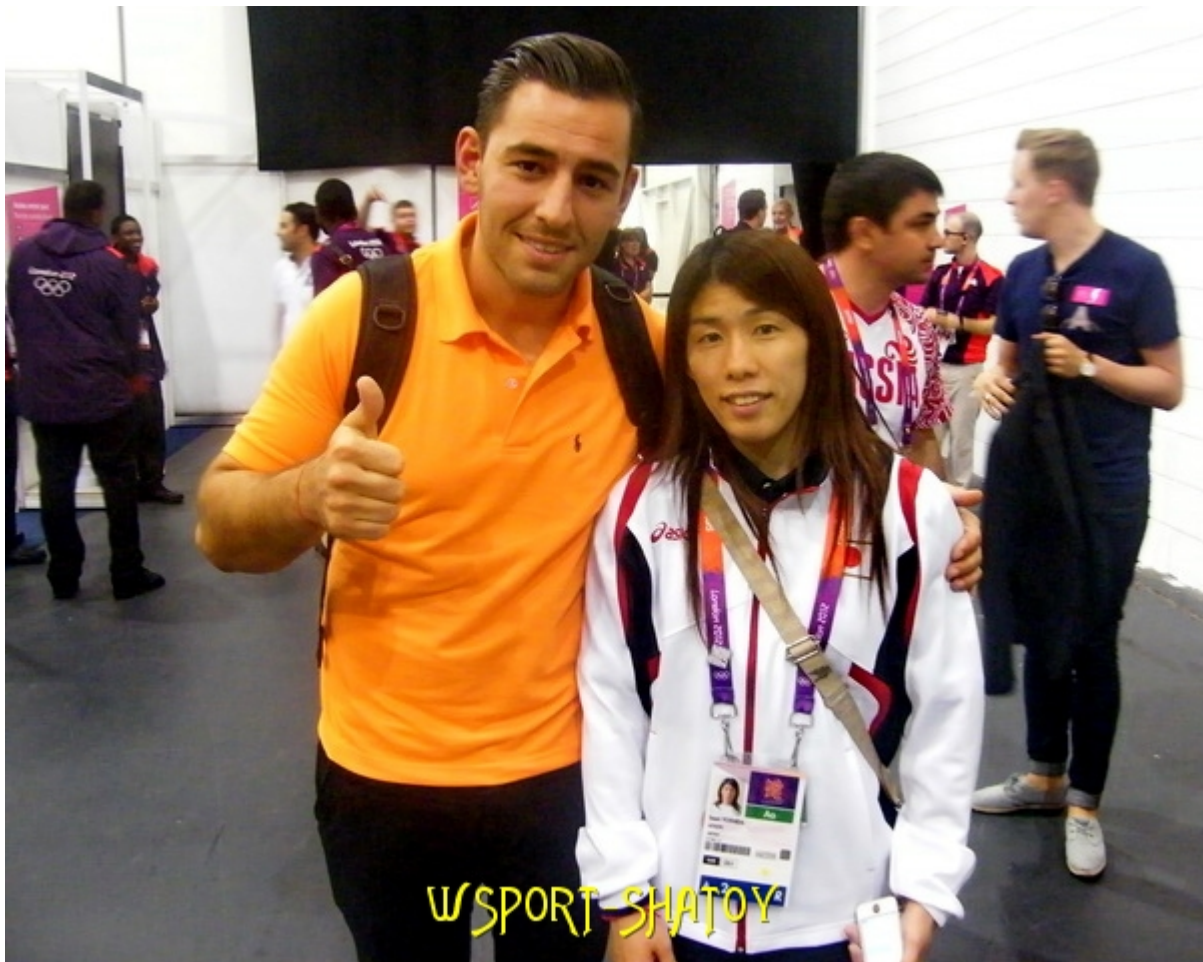
3-кратная олимпийская чемпионка Саори Йошида (Япония)