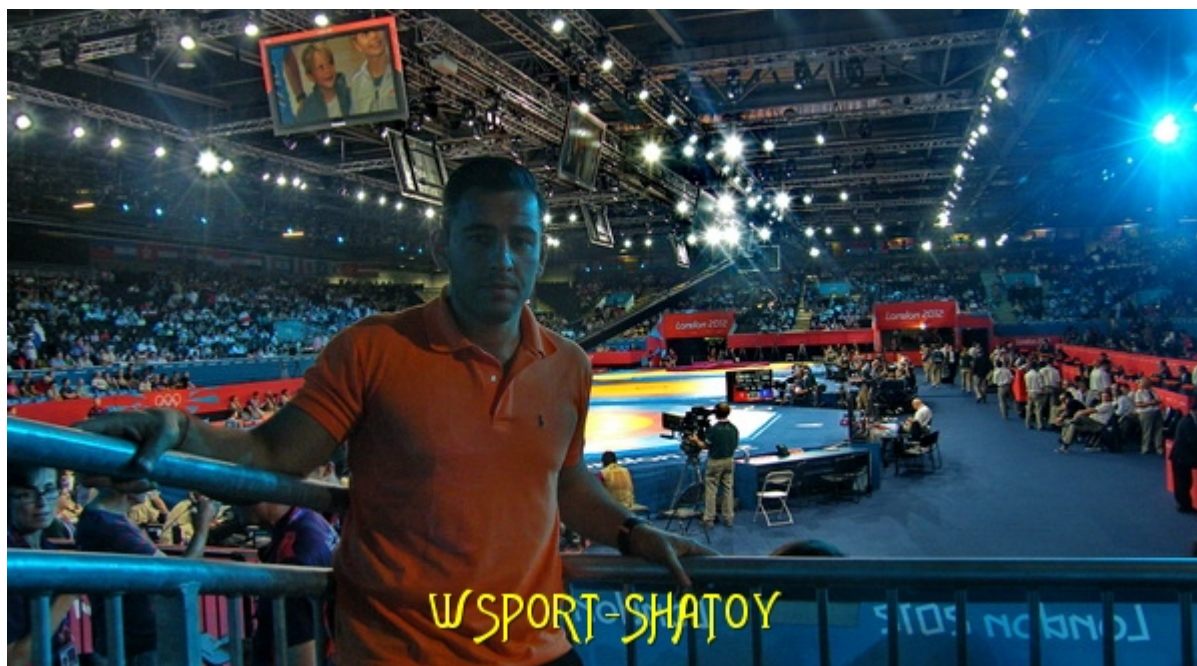
На соревнованиях по борьбе

Предлагаем читателям фоторепортаж Ислама Абдулаева из Лондона.