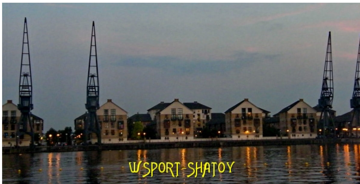
Вид от EXCEL через Темзу