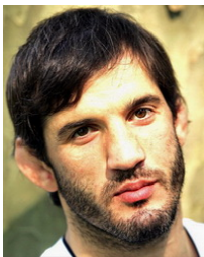
Бувайсар Сайтиев, вольная борьба

Впервые в истории чеченского народа олимпийским чемпионом стал Бувайсар Сайтиев.