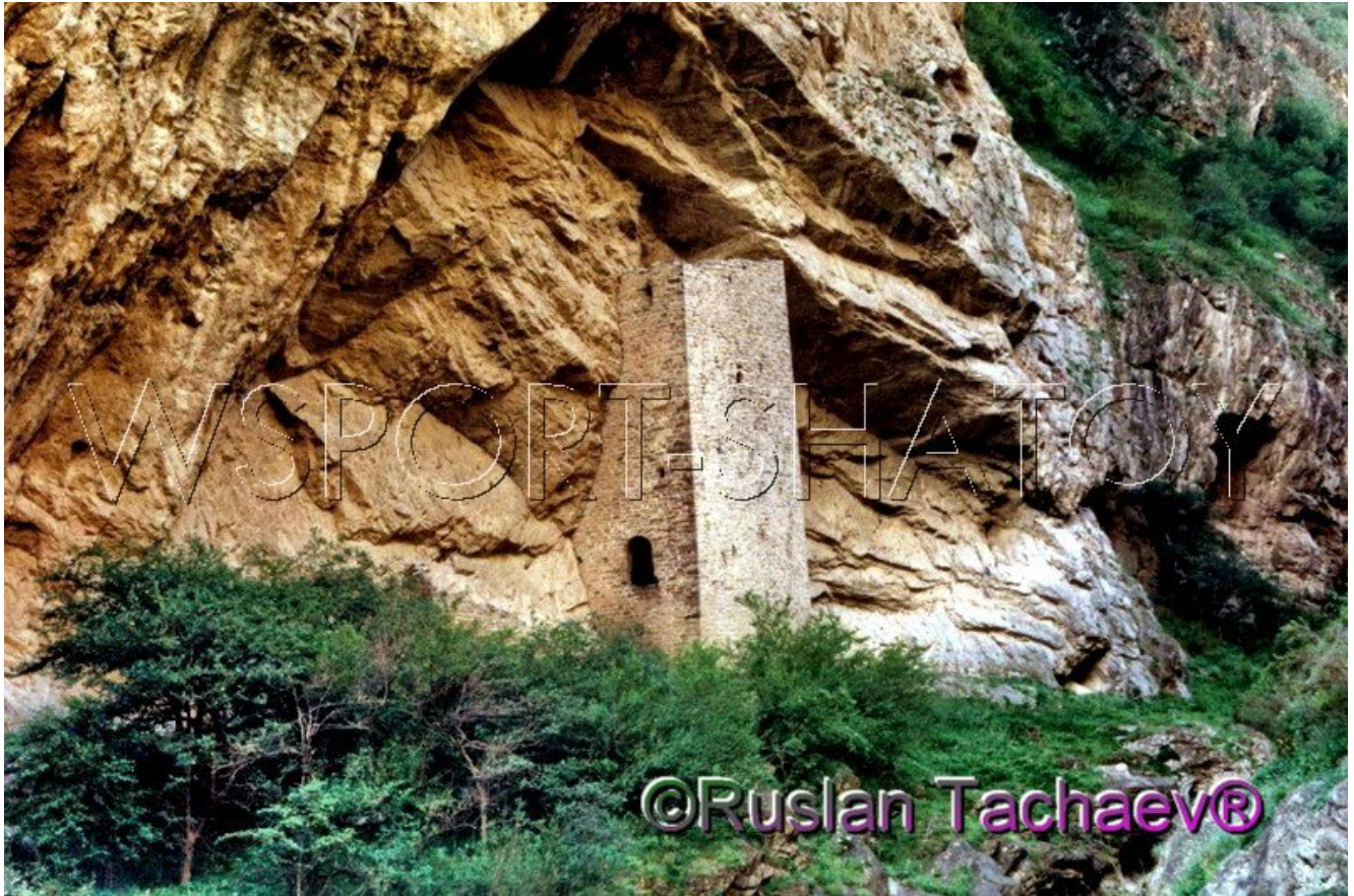
Ушкалойская боевая башня.