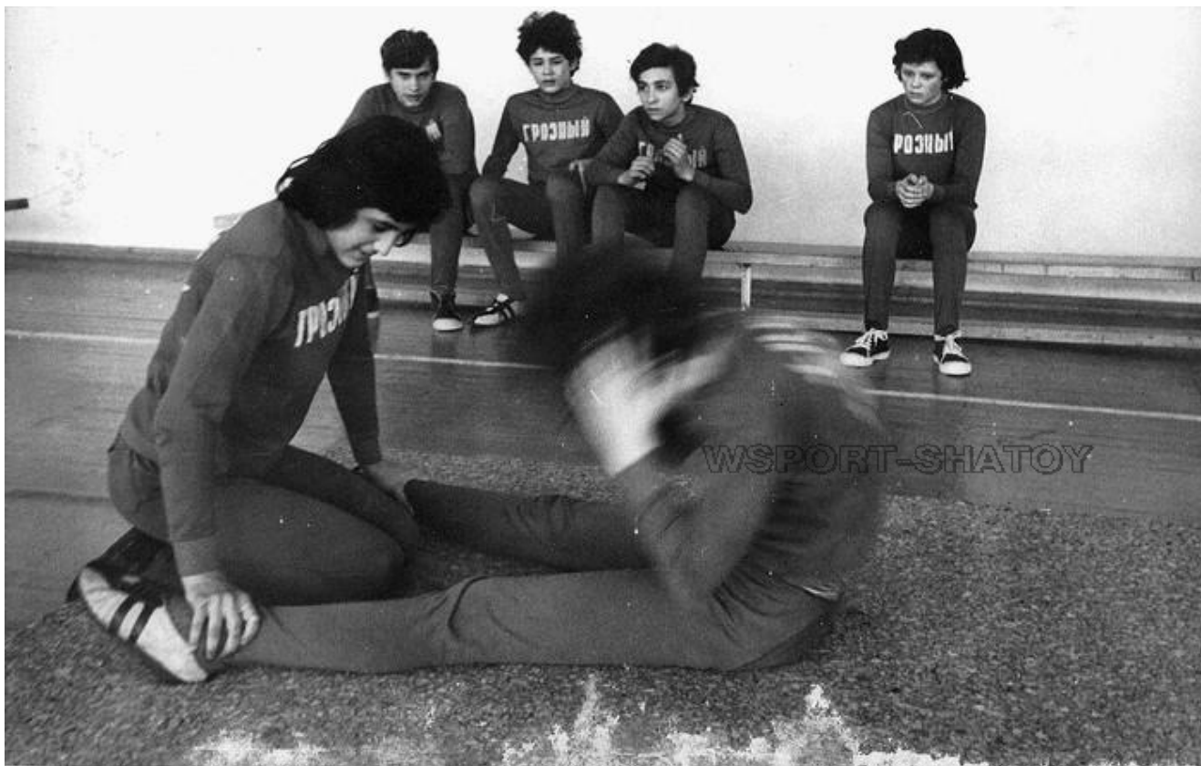
На тренировке, 1982 год.