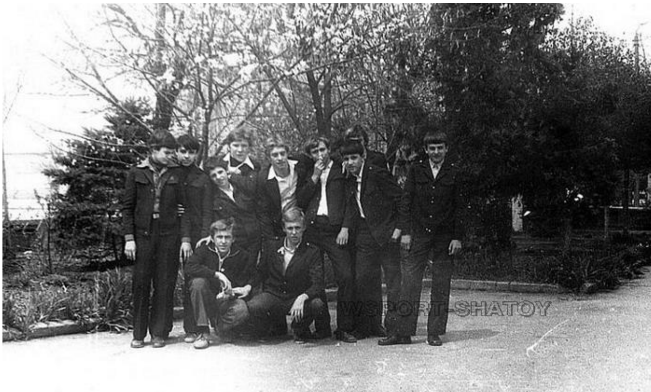
Спецкласс по плаванию