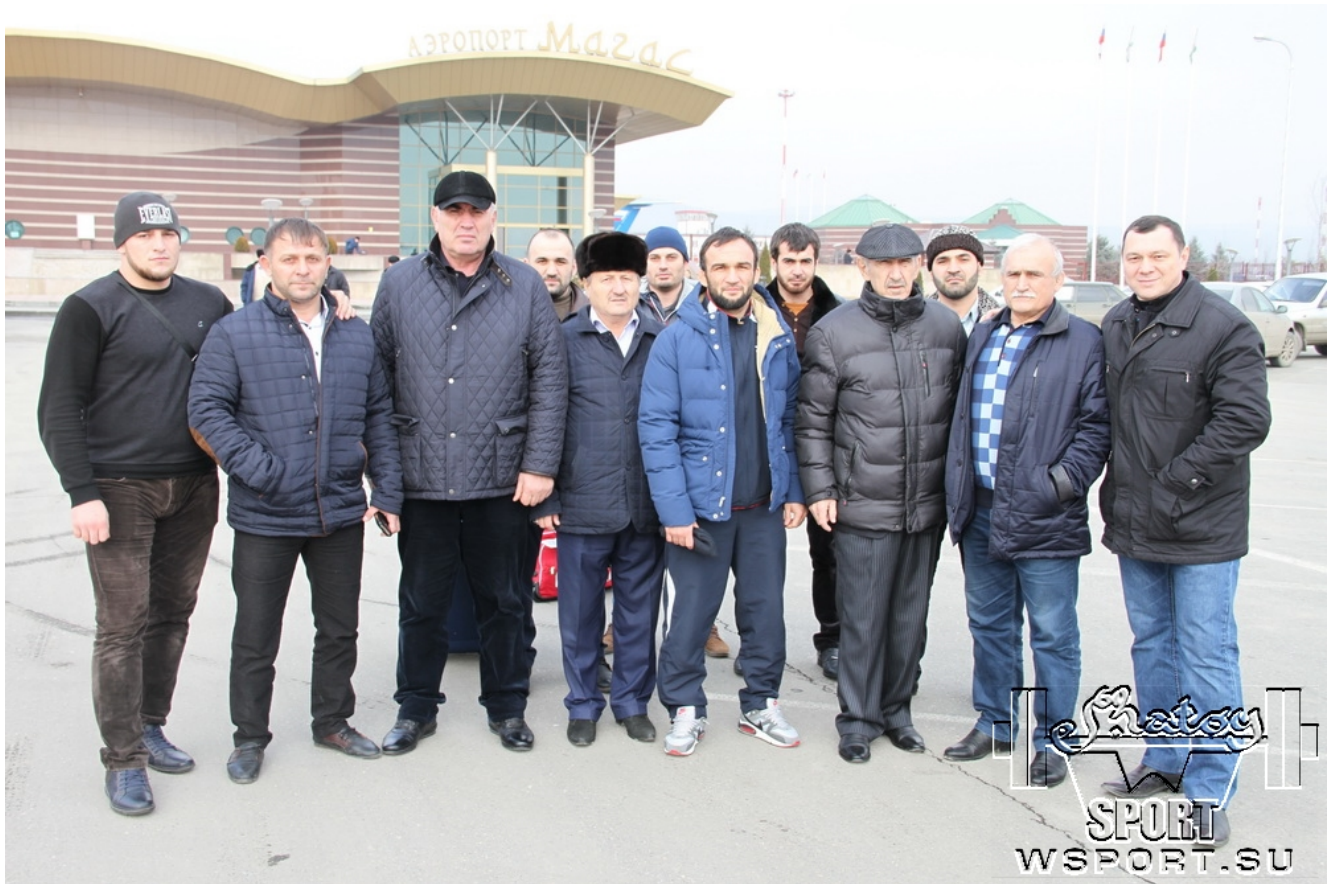
Встреча в аэропорту Магаса