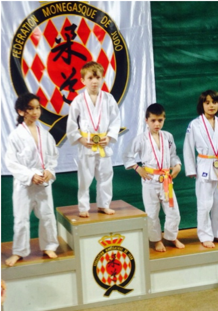
Чемпион Ахмад Табуев