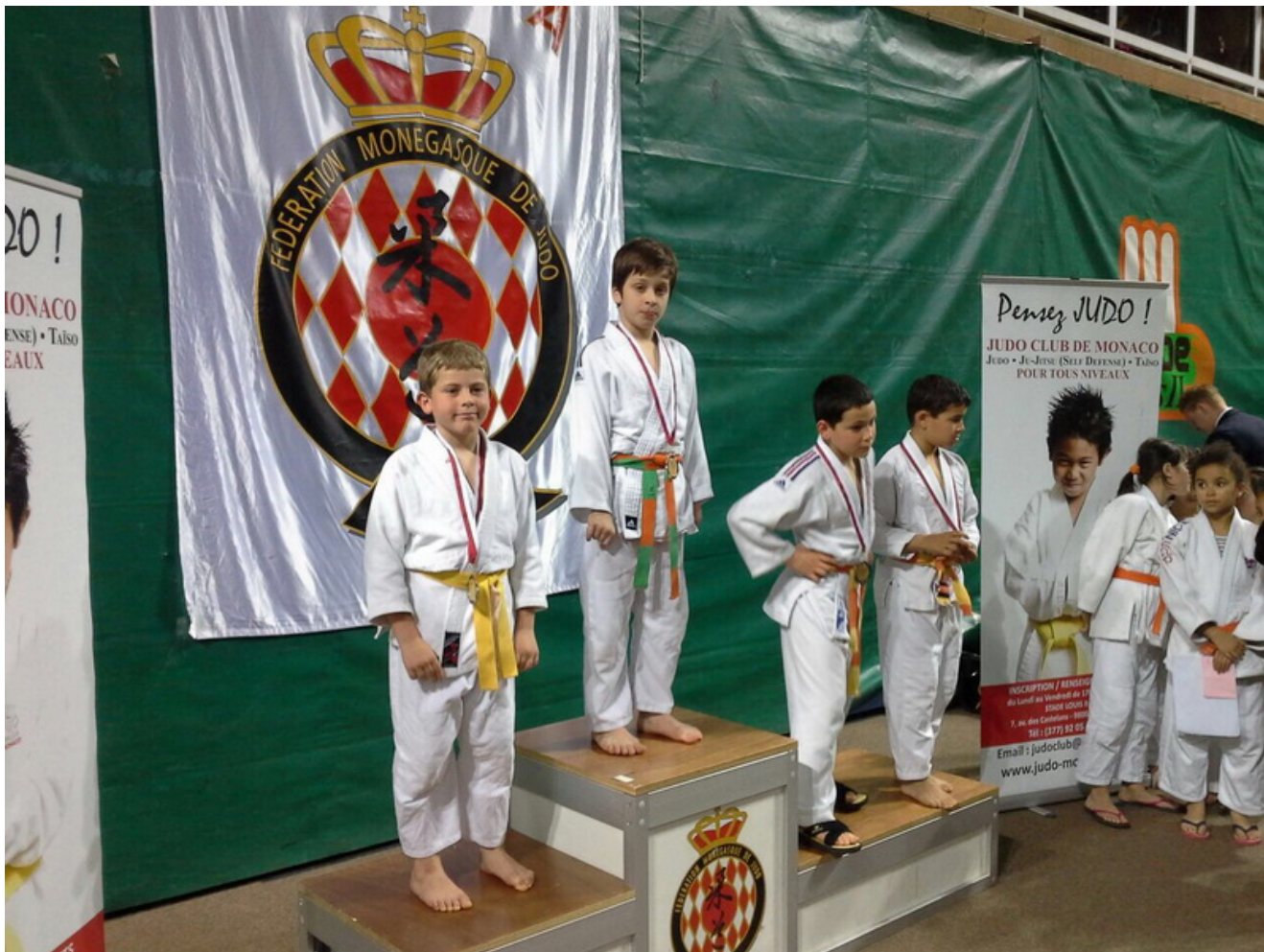
Чемпион Расул Хайтаев