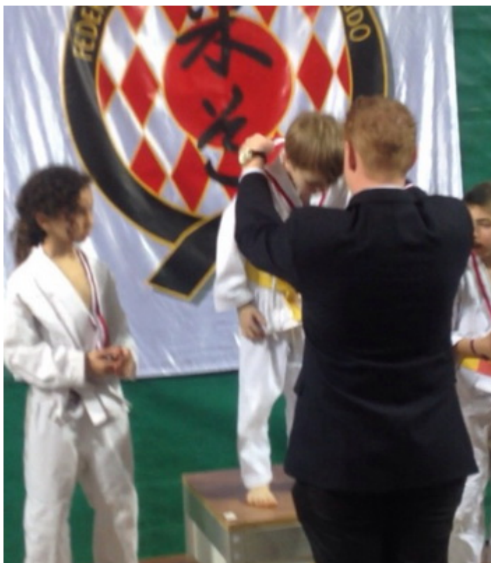
Чемпион Ахмад Табуев