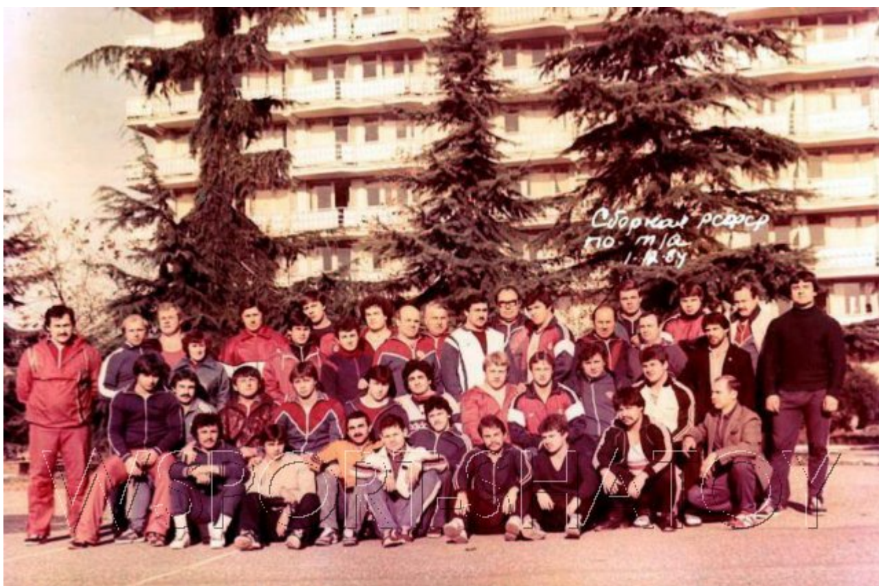
1984 год, Феодосия. Сборная РСФСР.