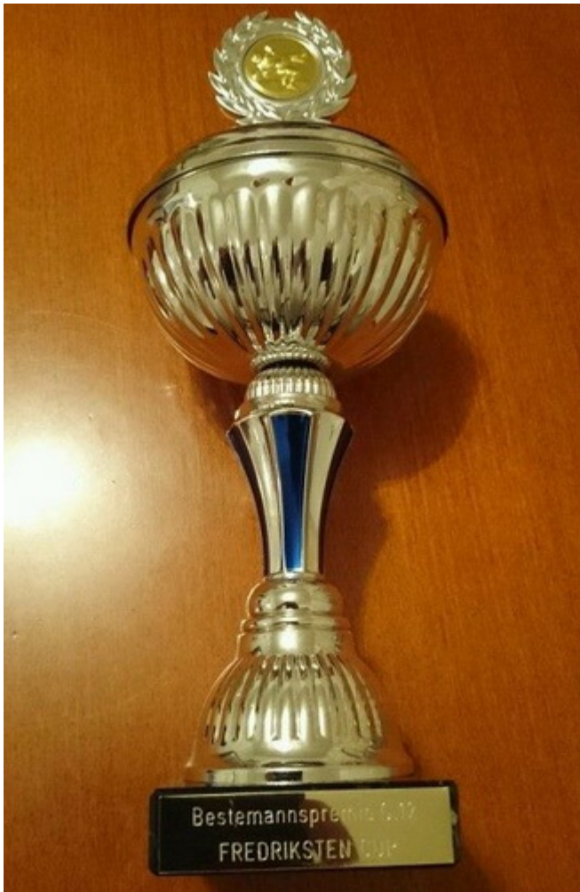
Кубок лучшего борца турнира