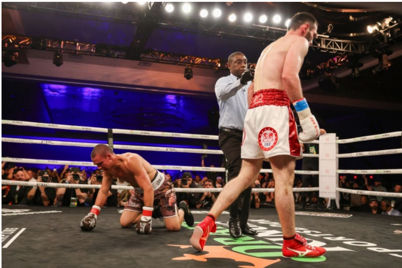
Тимофей Цзю в очередном нокадауне.