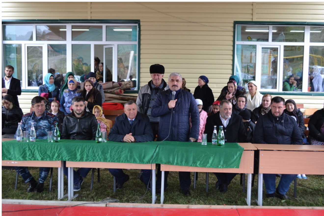
Турнир по дзюдо в с.Б-Варанды

Юные спортсмены показали хорошую техническую подготовку и волю к победе. Победители и призеры соревнований были награждены дипломами, кубками, медалями и ценными подарками.