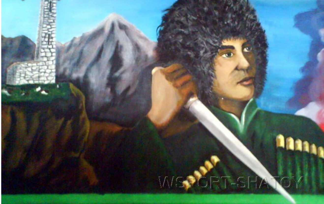
"С кинжалом". Рисунок С.Долтабаева.