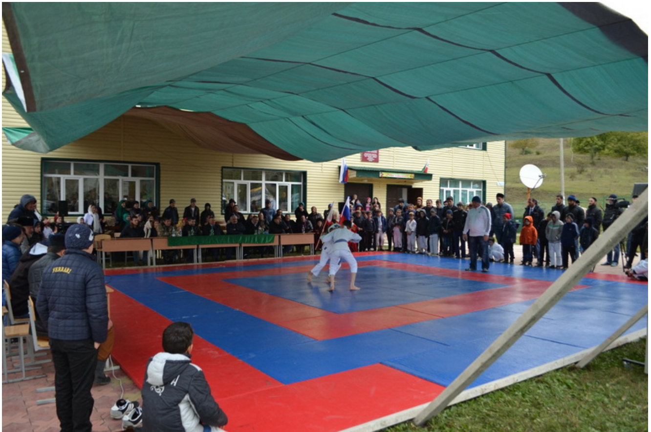
Турнир по дзюдо в с.Б-Варанды