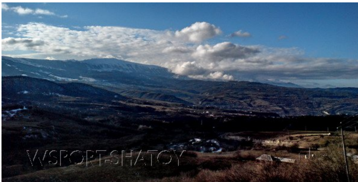
Шатой вдали. Январь 2008 г.