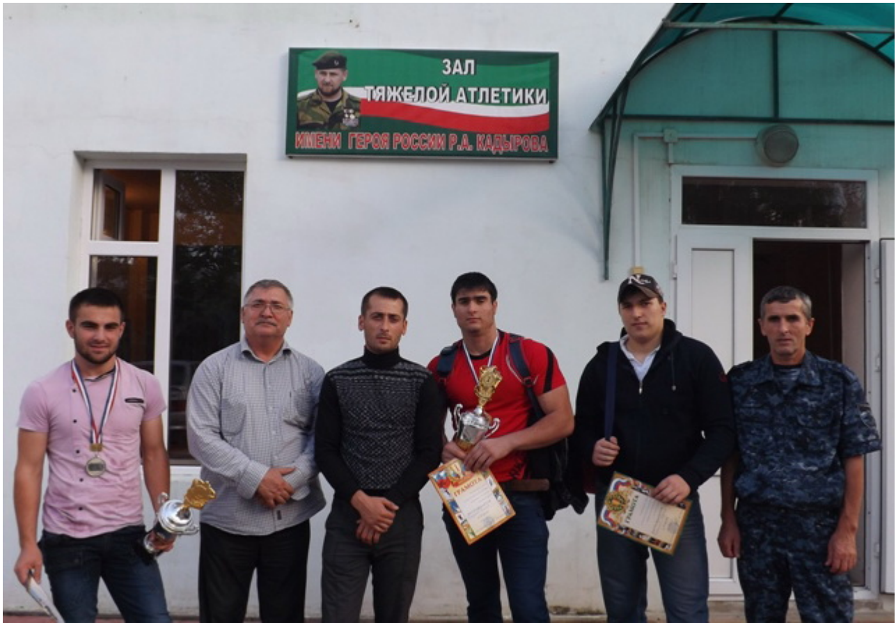
Победители и призеры