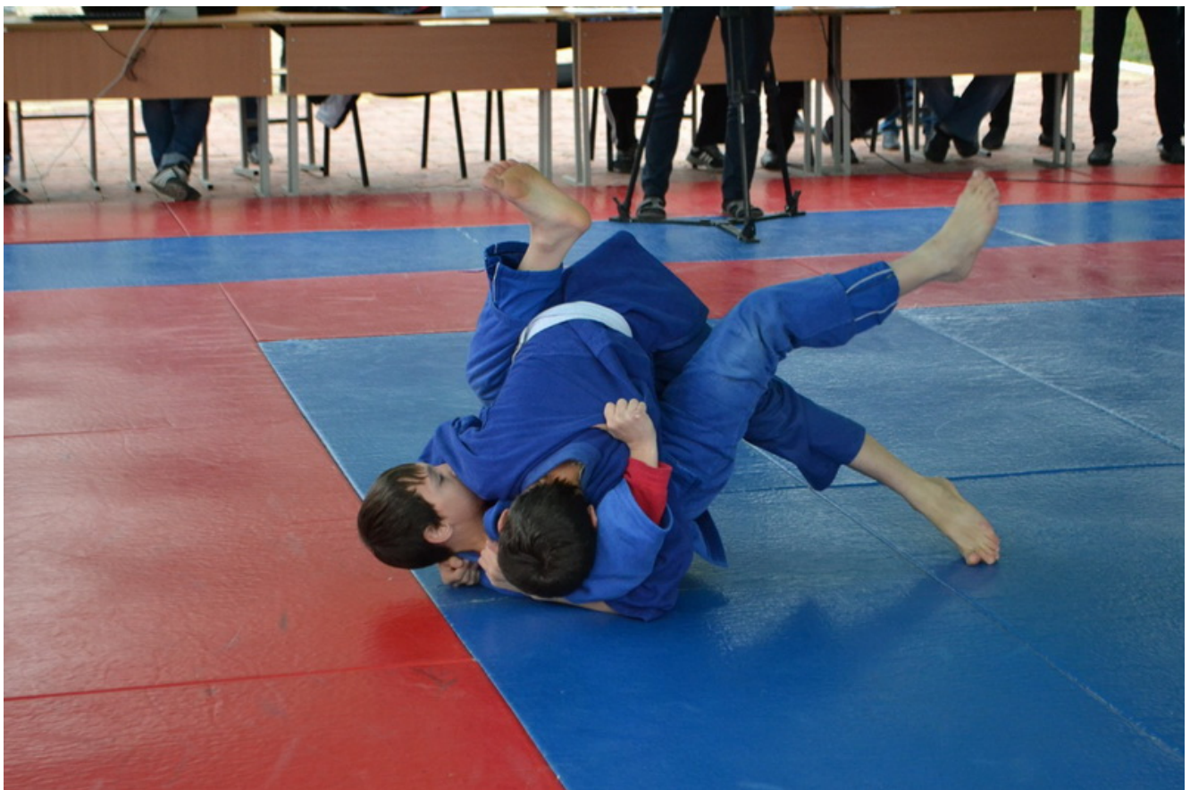
Турнир по дзюдо в с.Б-Варанды