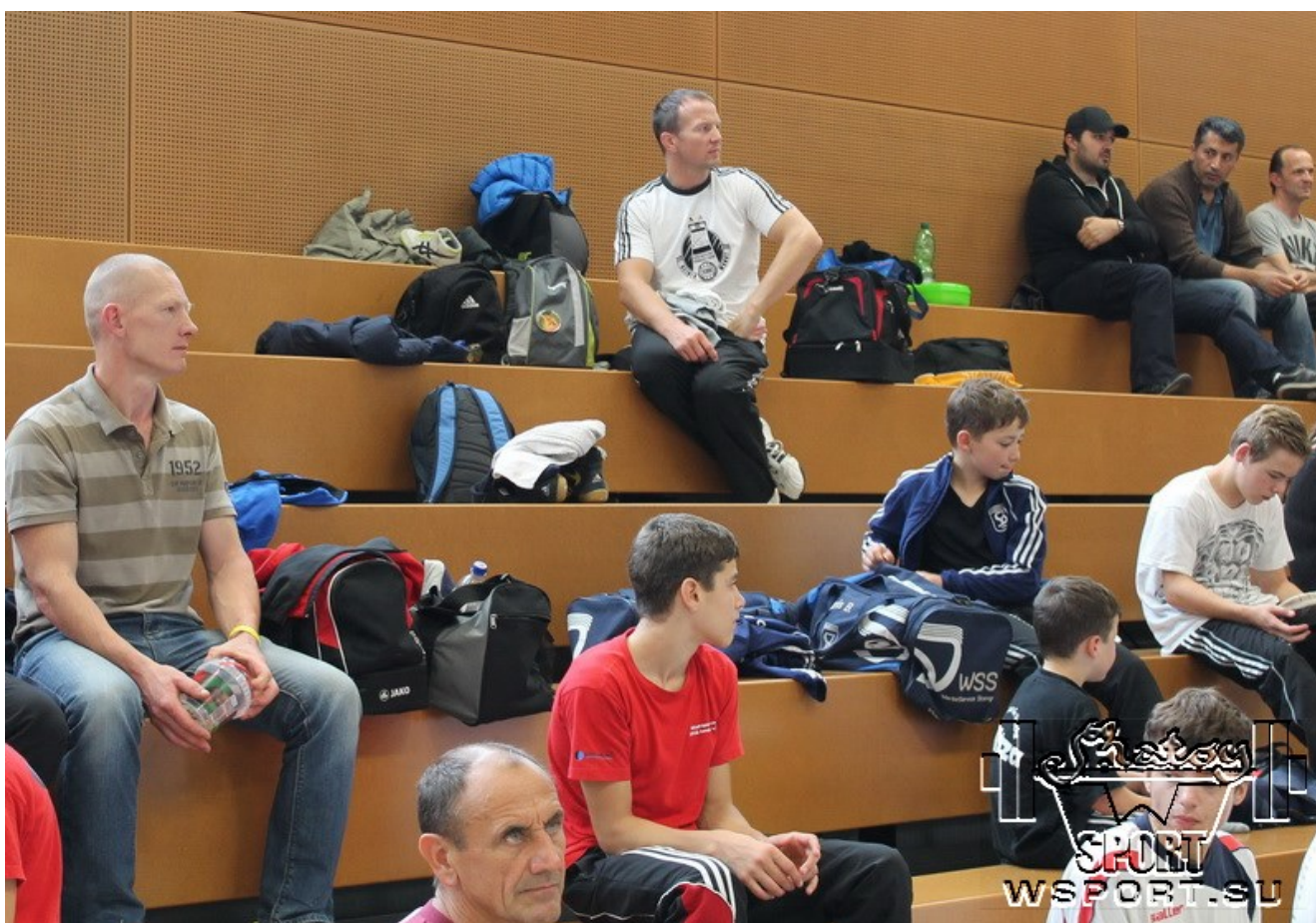
Знаменитый Александр Ляйпольд на трибуне.