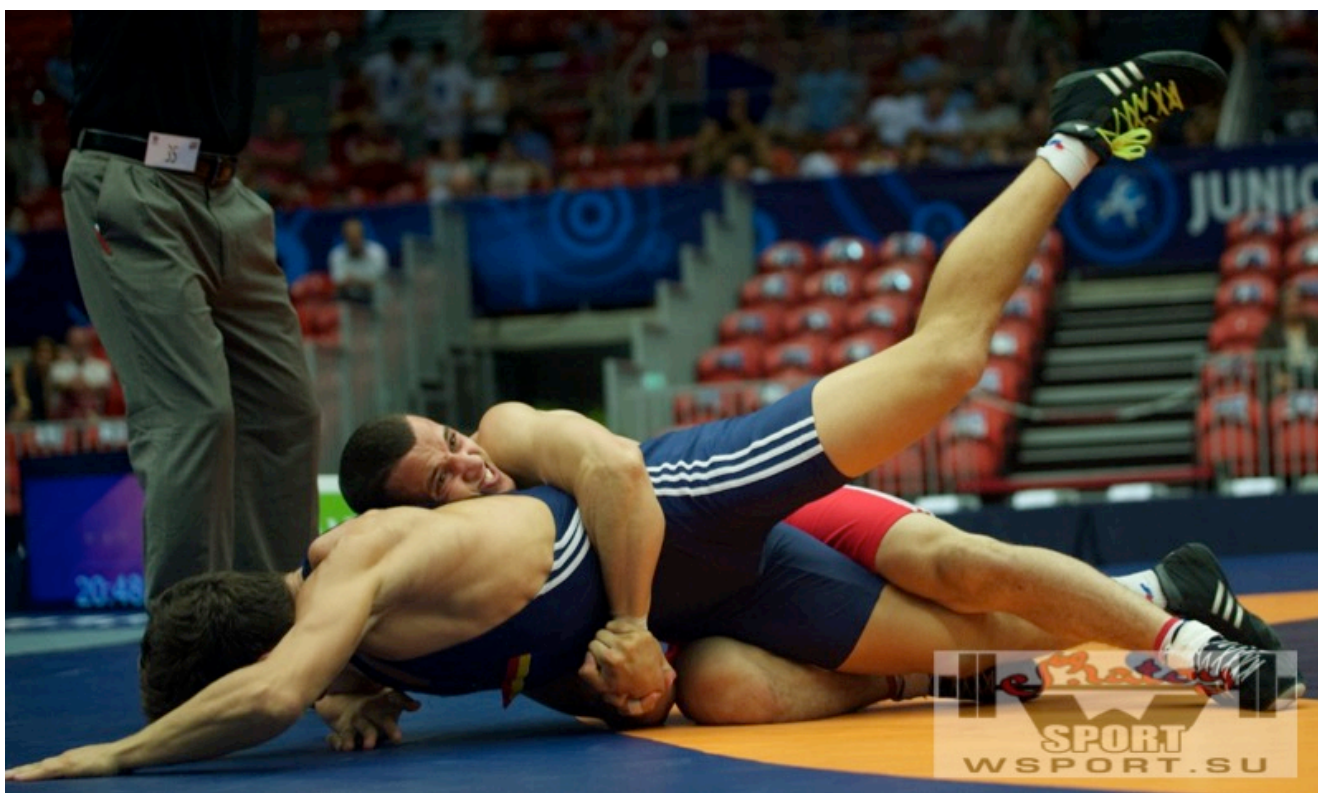
Тамерлан Шадукаев - чемпион мира-2016 среди юниоров