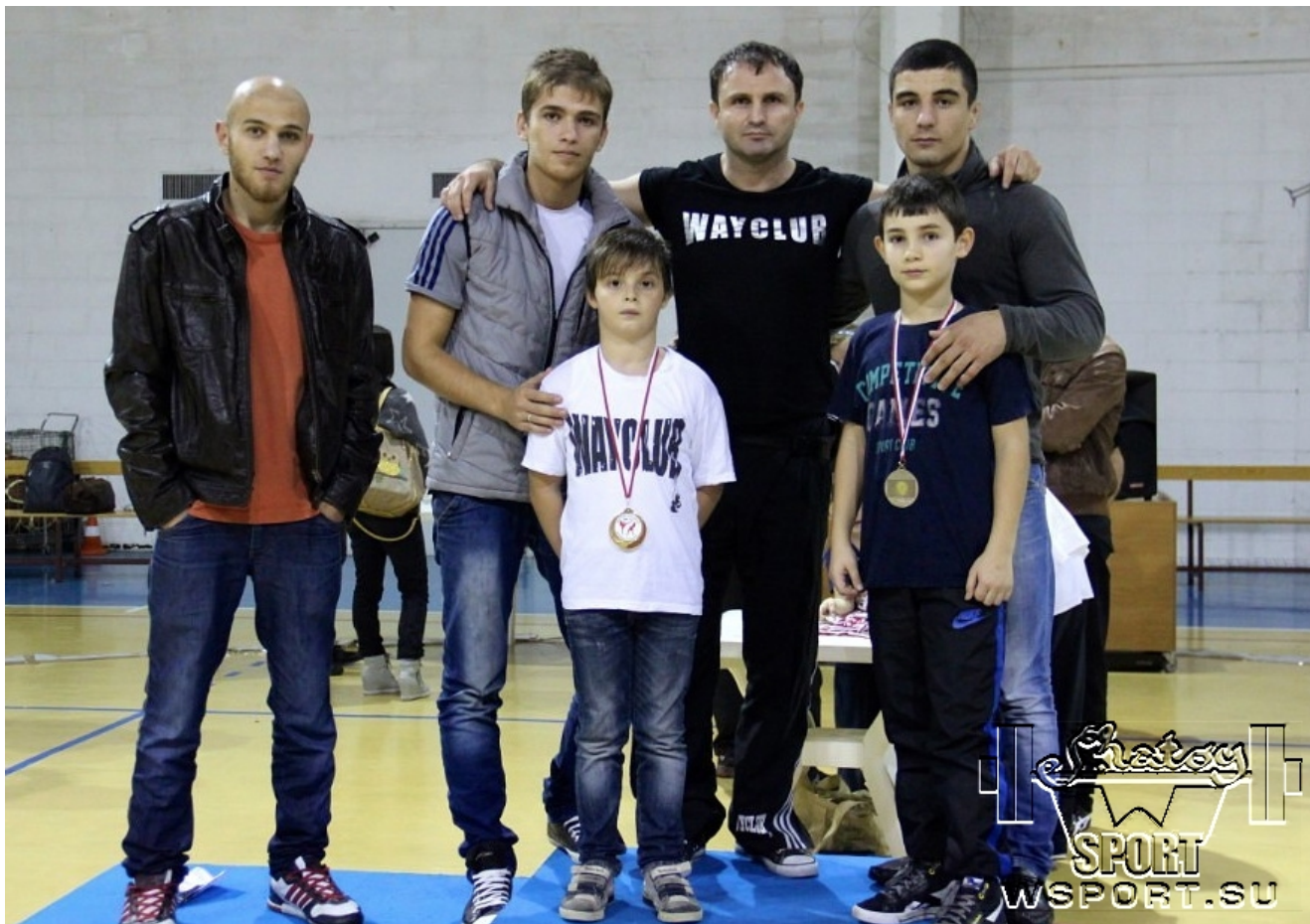
Тренер, спортсмены и группа поддержки из Ниццы