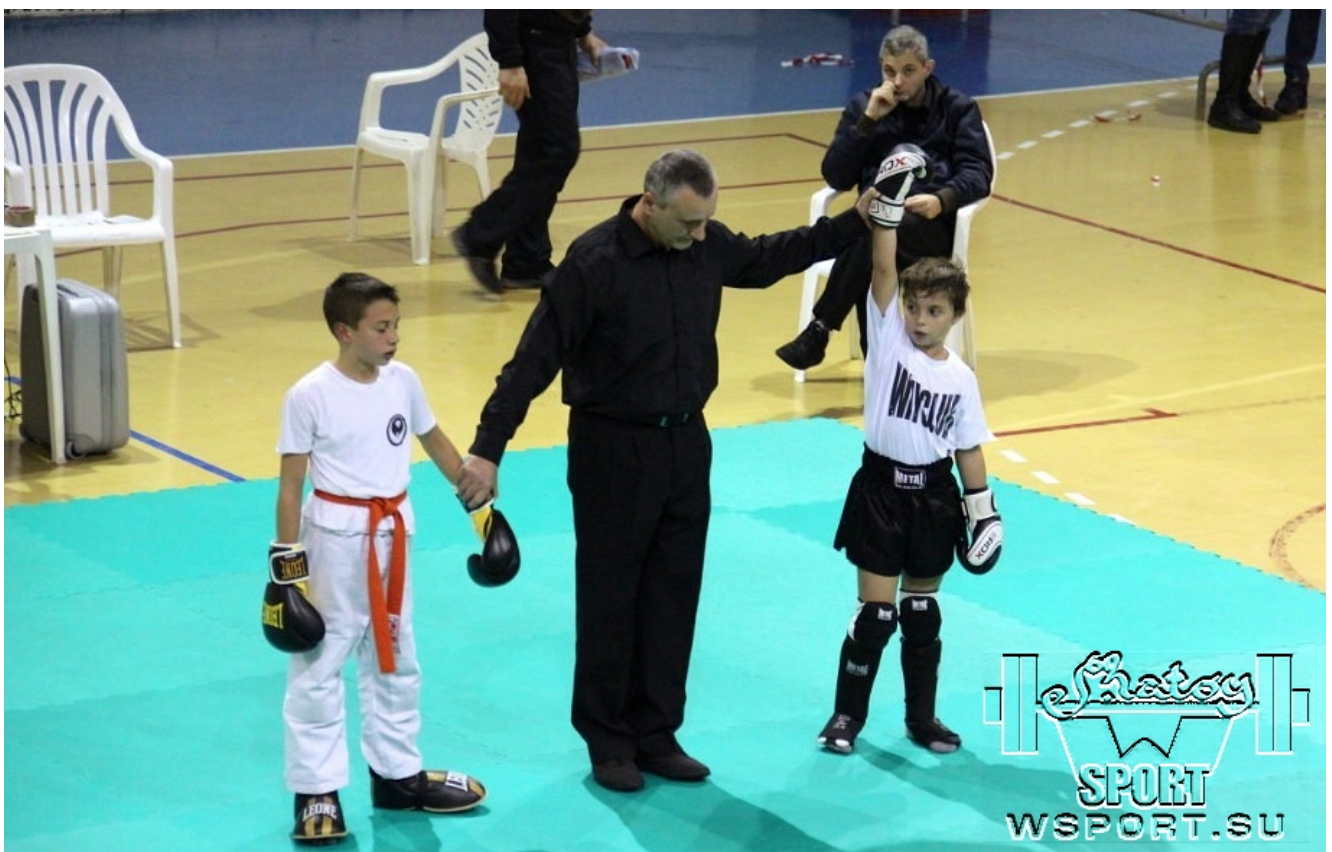
Есть победа и звание чемпиона