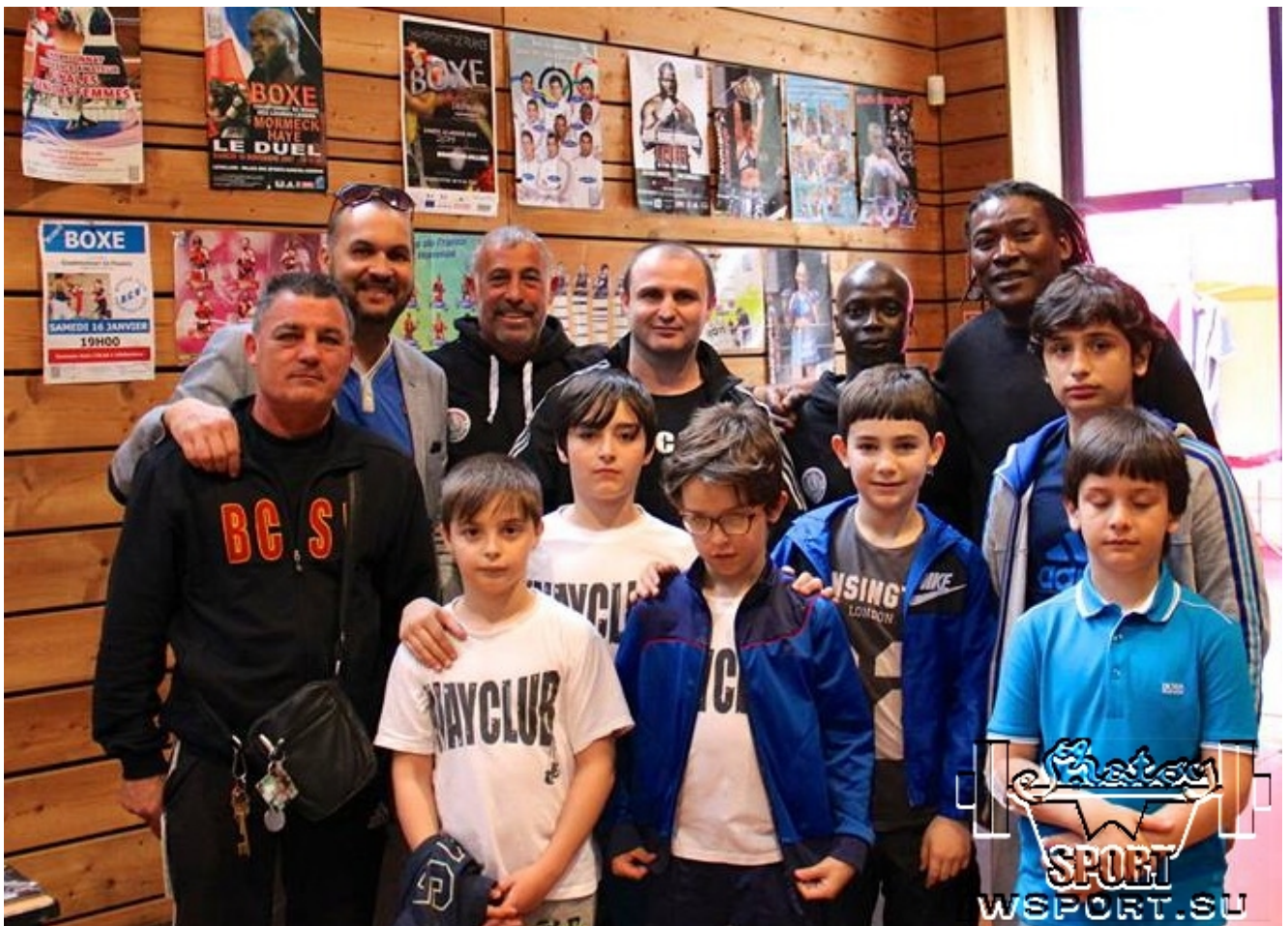
Руководство клуба Сен-сюр-Мер готово сотрудничать с