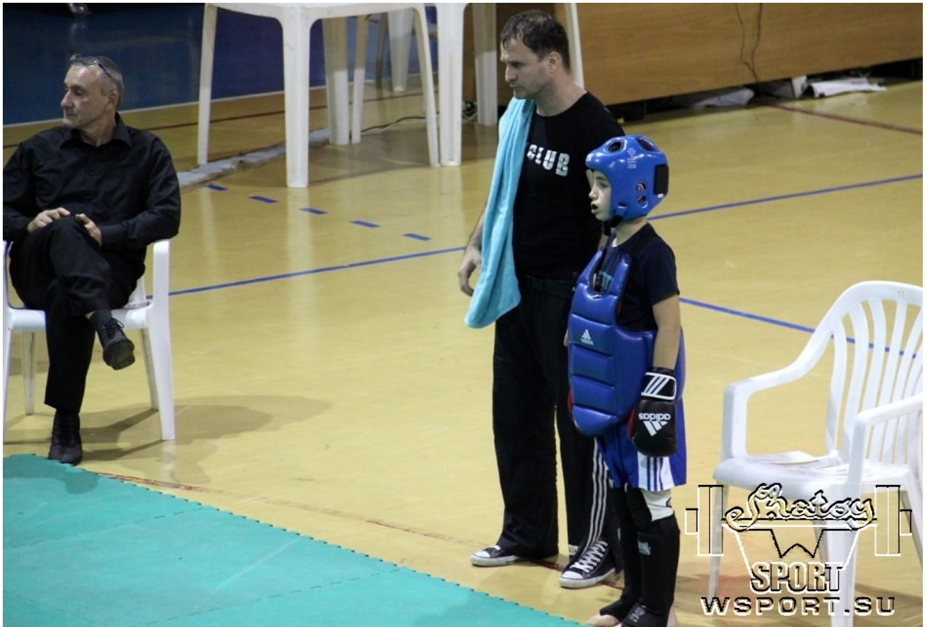
Султан к битве готов