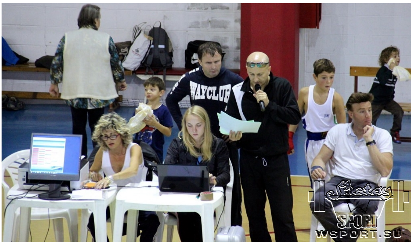
Объявляют спорное решение