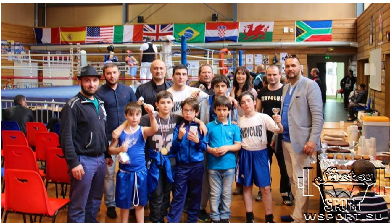
Представители мэрии и руководство клуба Сен-сюр-Мера с командой "Вайклуба"