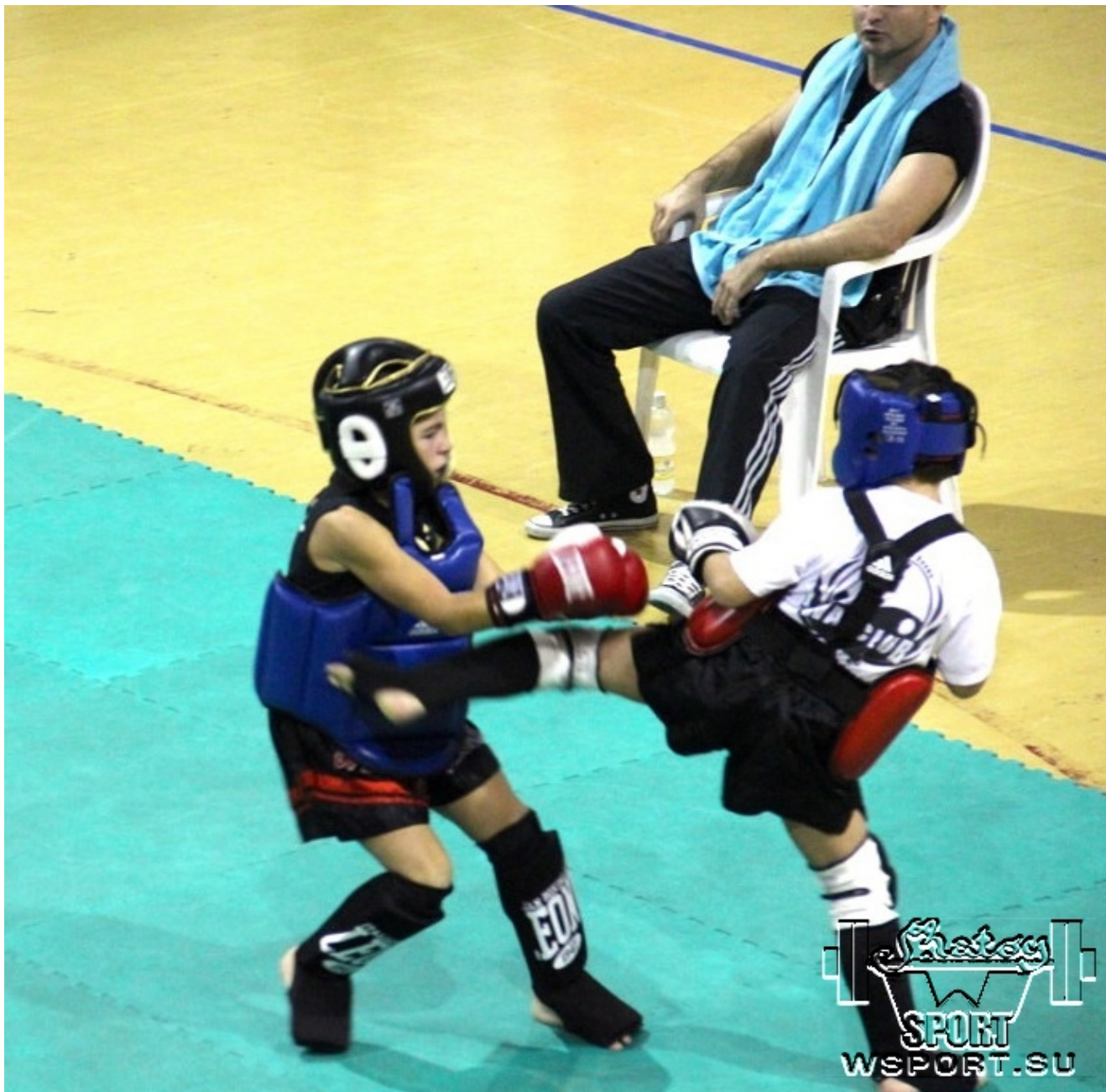
Адам попадает в печень