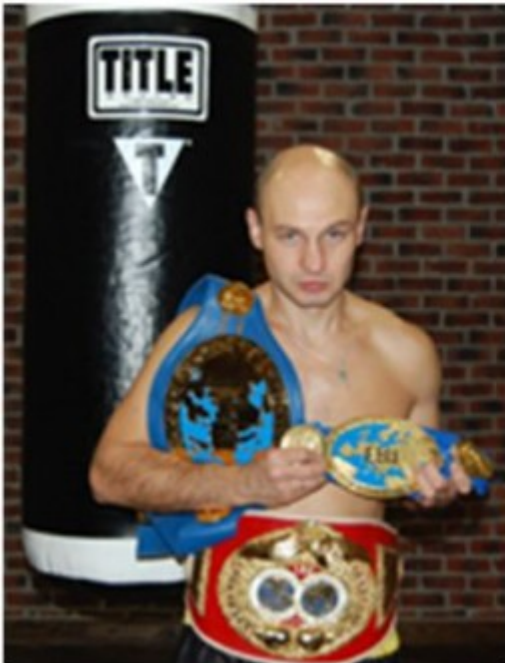
Boris Sinitsin Champion du Monde 2 fois : Champion d'Europe 7 fois Boxe Professionnel