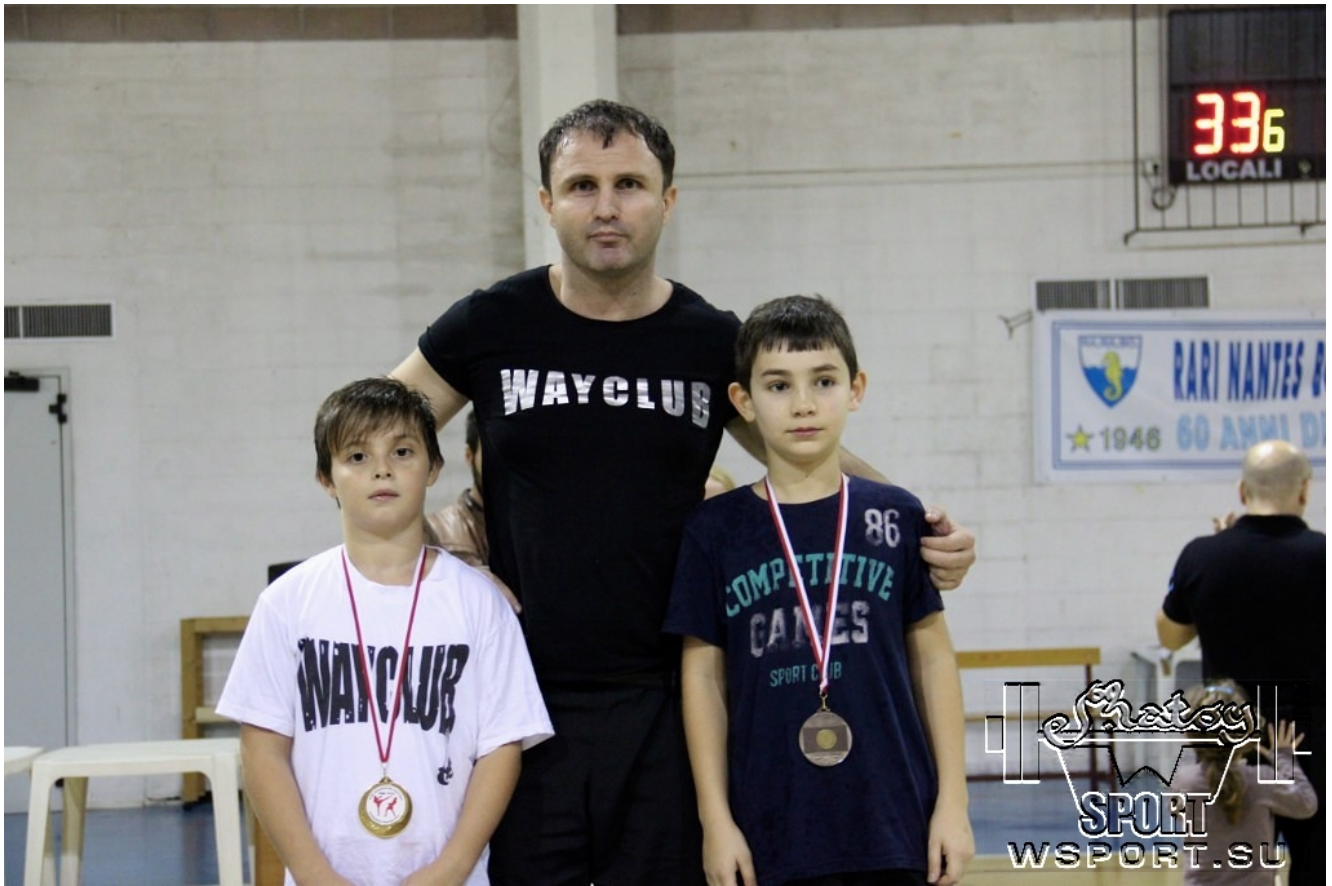
Тренер и ученики