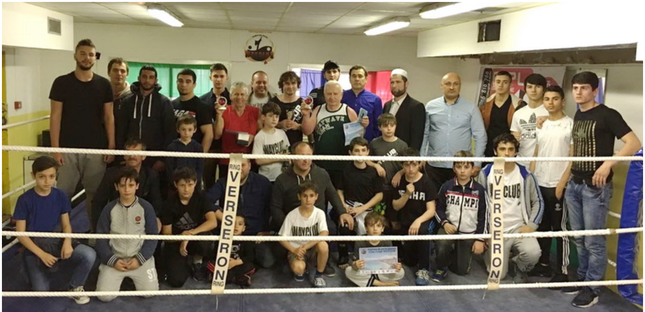
Участники и зрители 2-го Кубка Вайклуба после соревнований