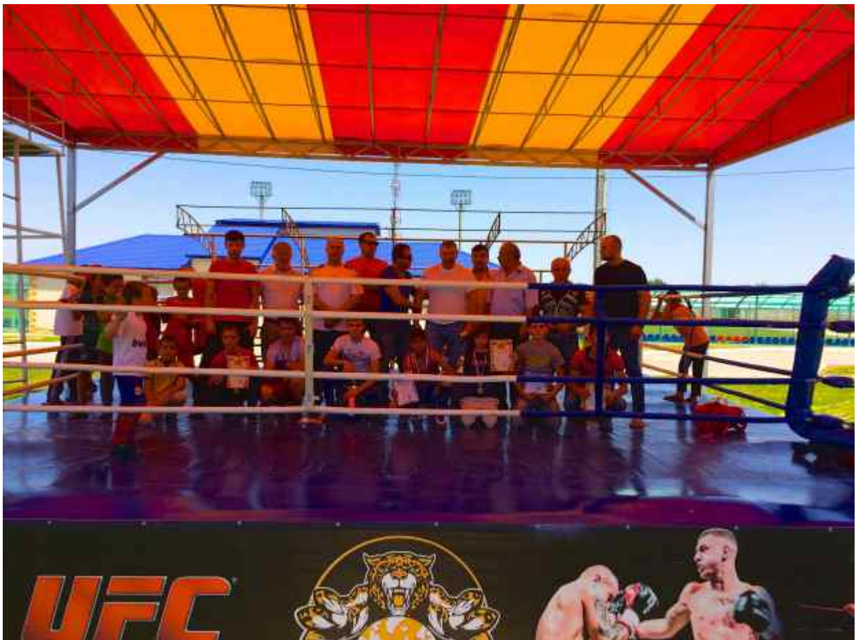
Организаторы турнира и тренеры