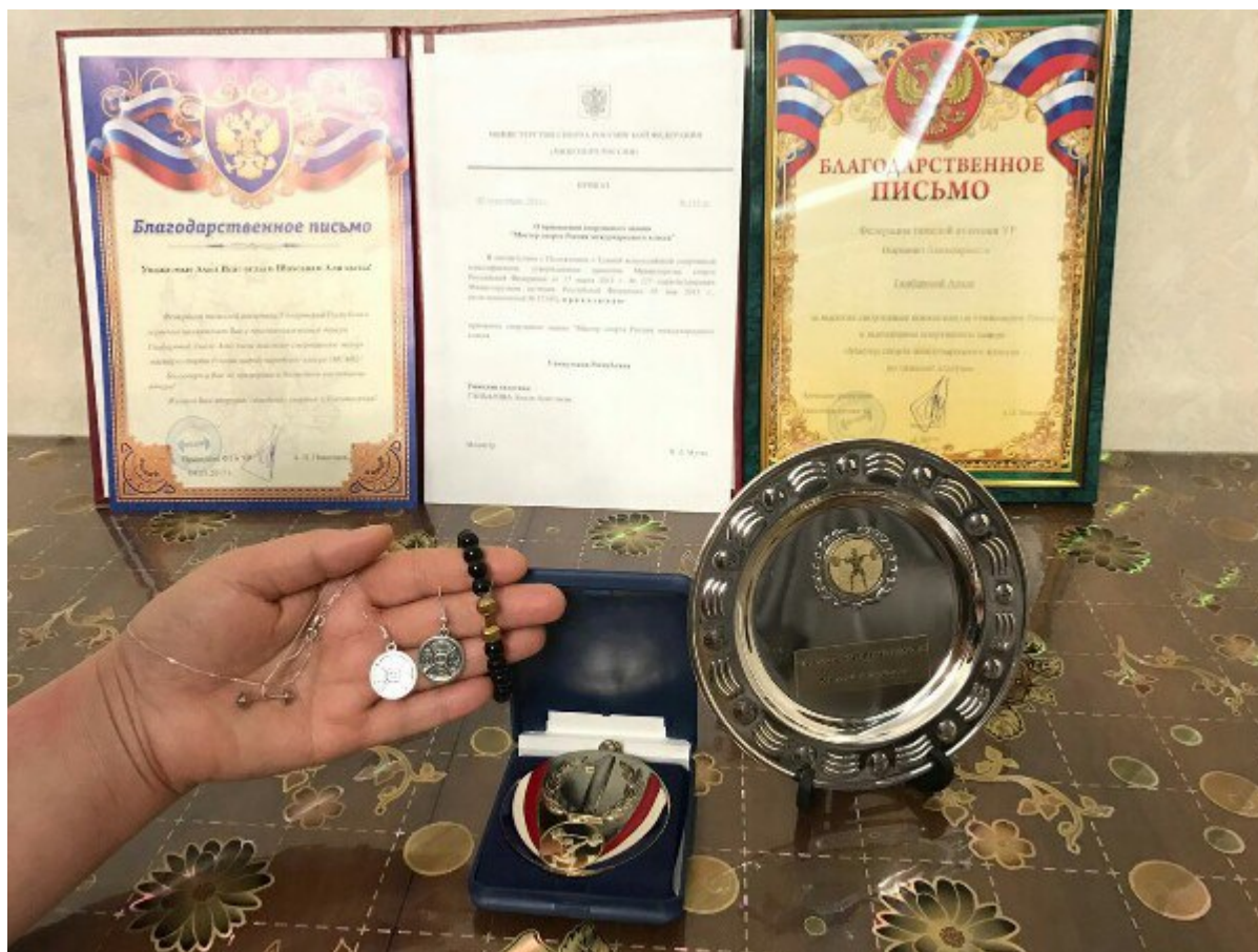
Призы WSPORT - SHATOU

[youtube id=»TijVKtwZb80″ width=»620″ height=»360″]