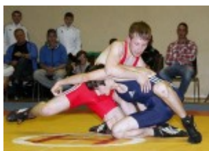
Кубок Спессарта 2012