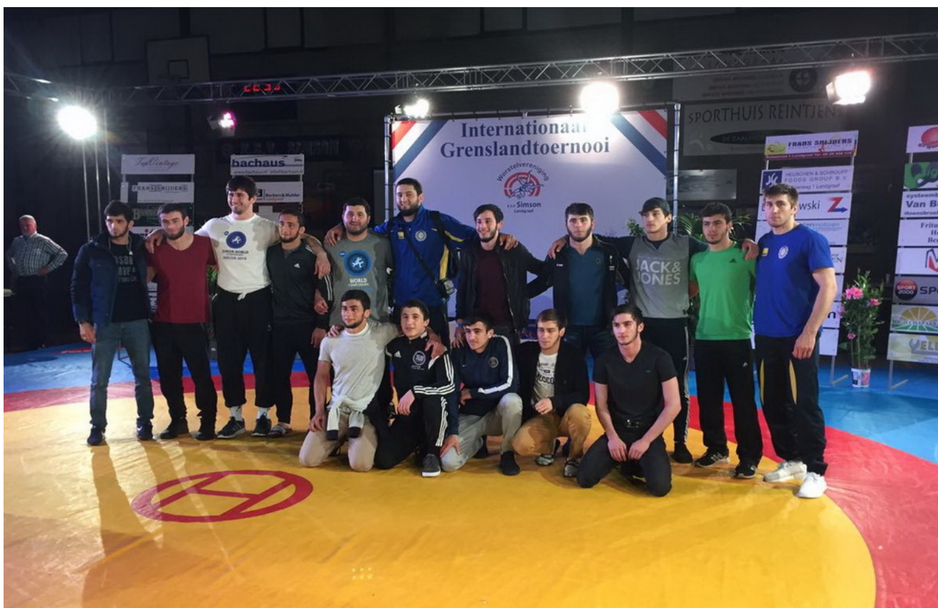
Вайнахские спортсмены после соревнований