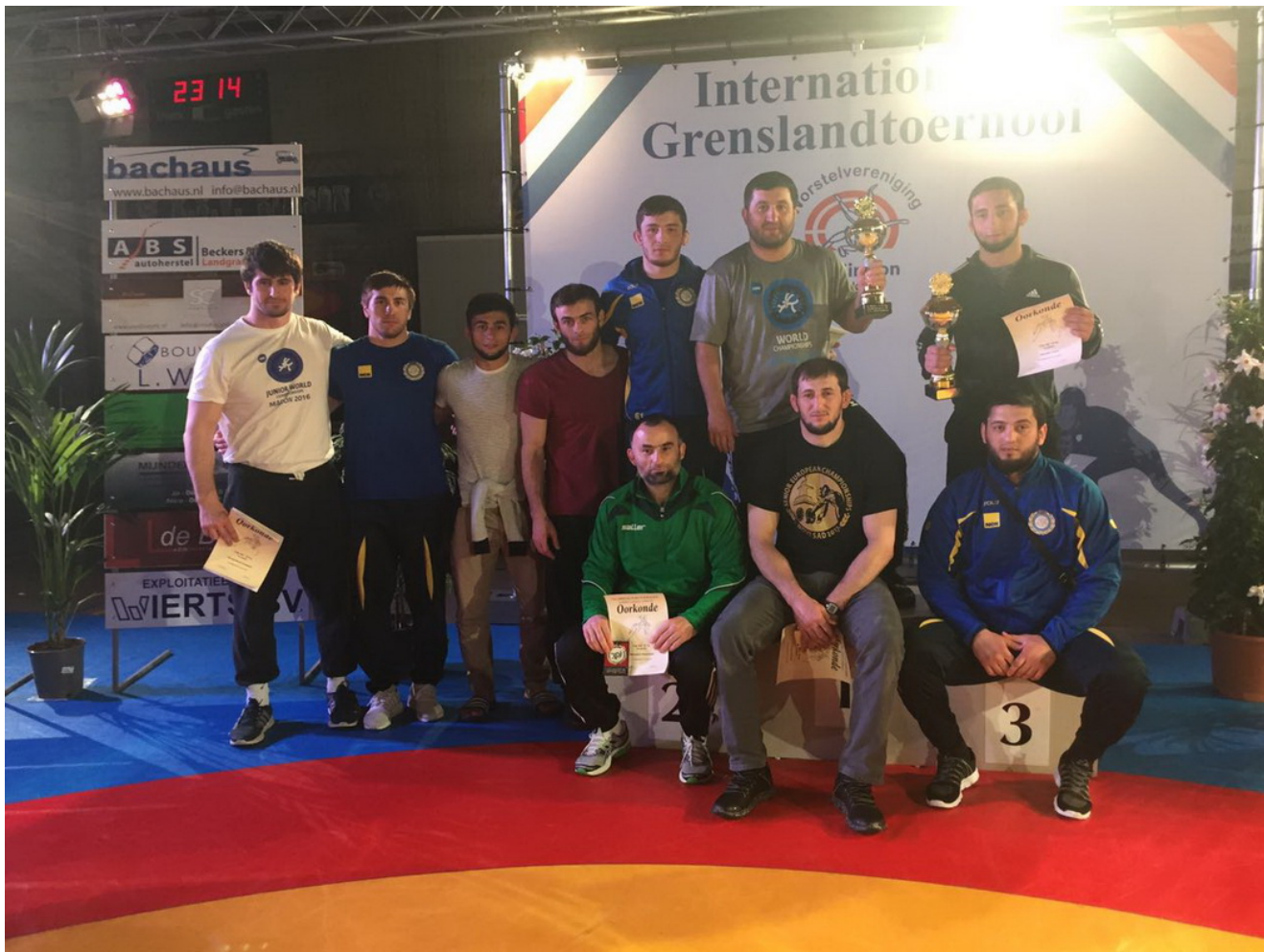
Вайнахские спортсмены после соревнований