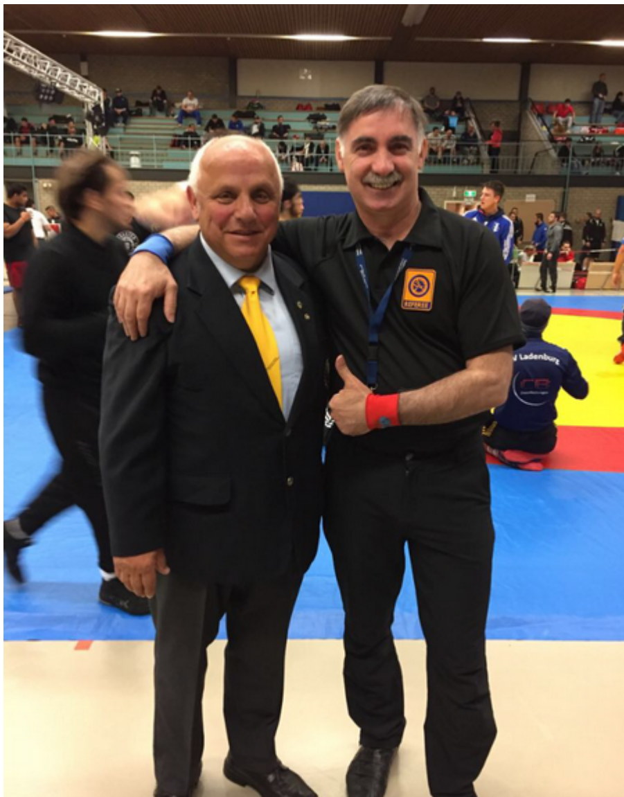
Опытнейший немецкий арбитр Хорст Фаллер и Иса Гамбулатов