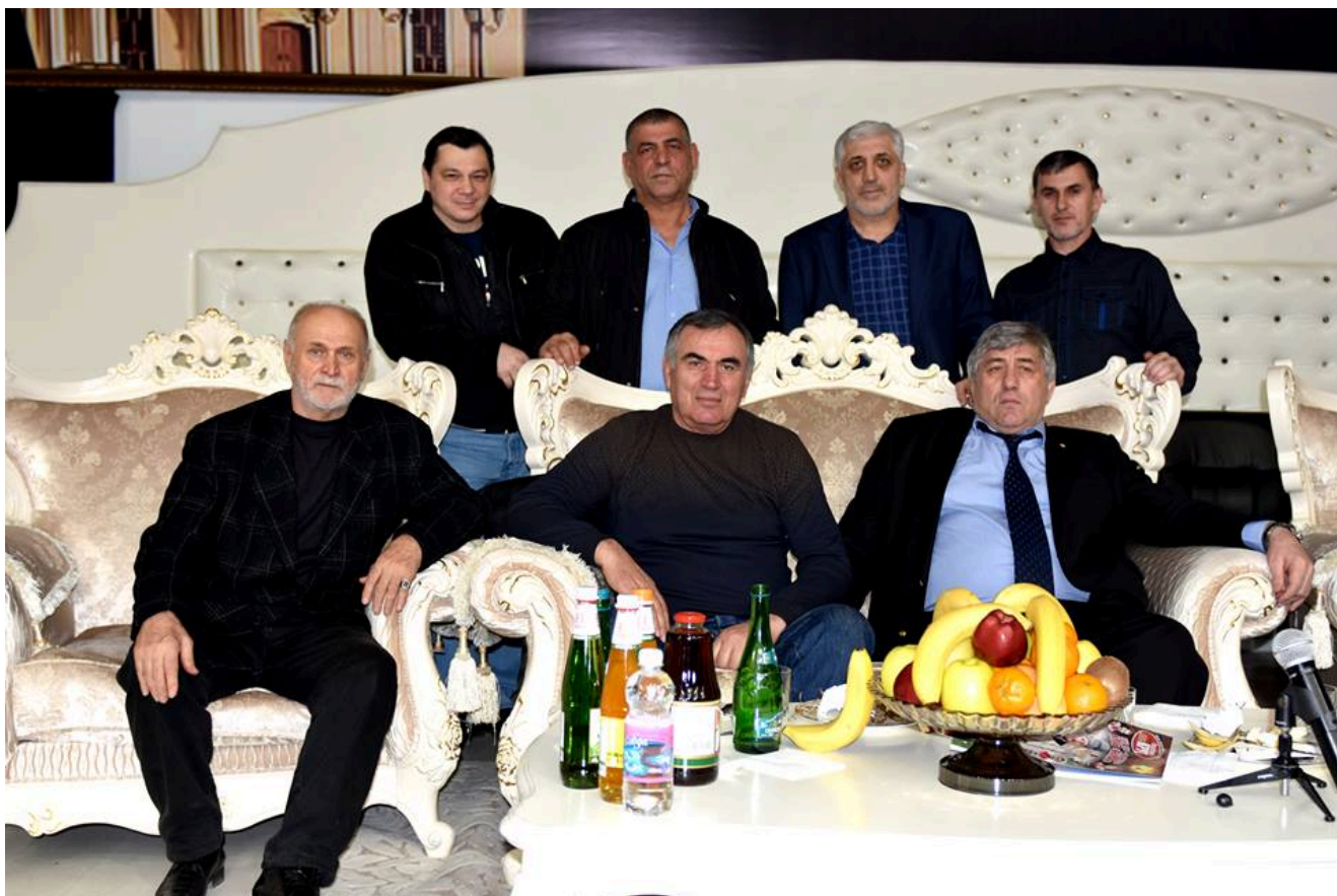
1-й Всероссийский турнир памяти Адлана Вараева. Почетные гости.