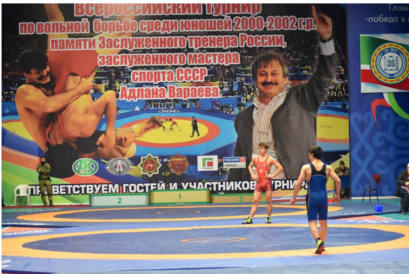
1-й Всероссийский турнир памяти Адлана Вараева