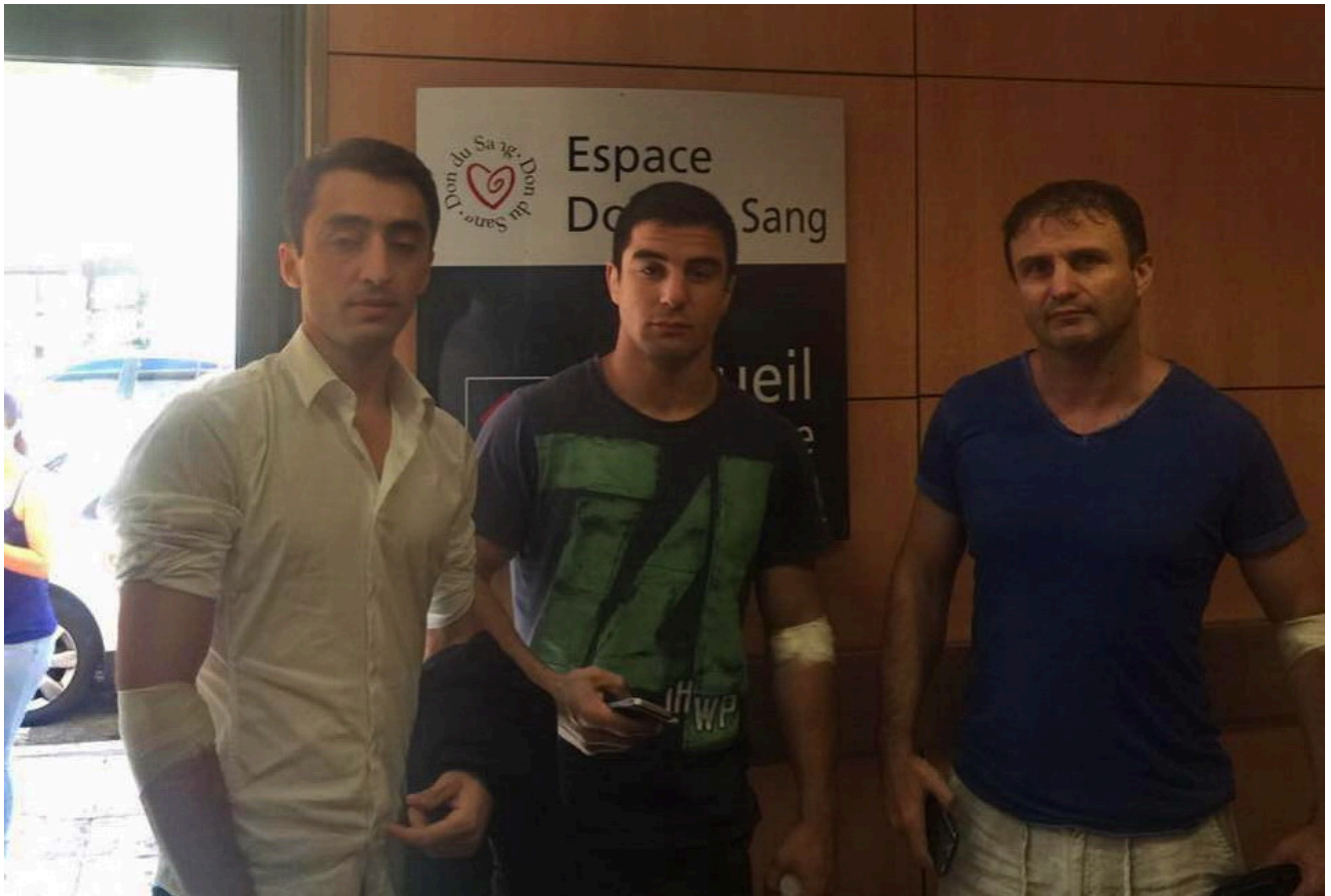
В пункте сдачи крови