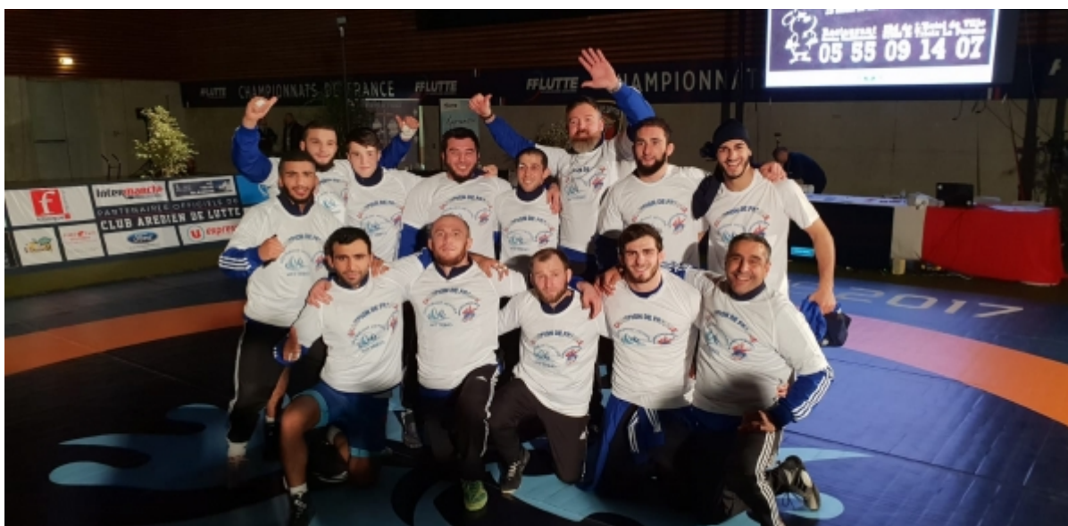
Обладатель командного чемпионата Франции – клуб Сарргемин