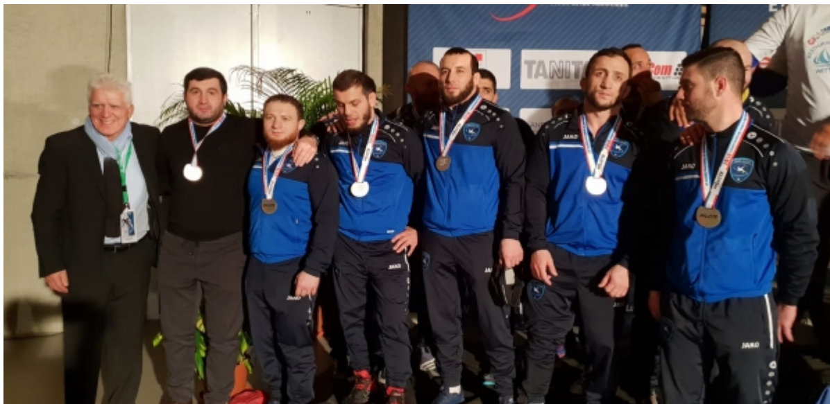
Серебряный призер командного чемпионата Франции – клуб Соттевиль-ле-Руан