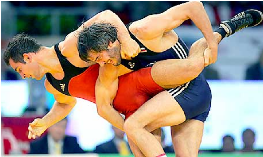
2-кратный чемпион Европы и серебряный призер чемпионата мира-05 Арпад Риттер в поединке с Бувайсаром Сайтиевым