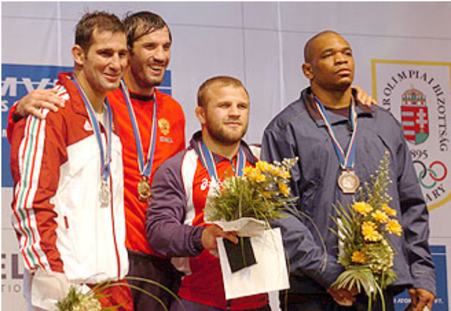
Арпад Риттер (слева) и Бувайсар Сайтиев