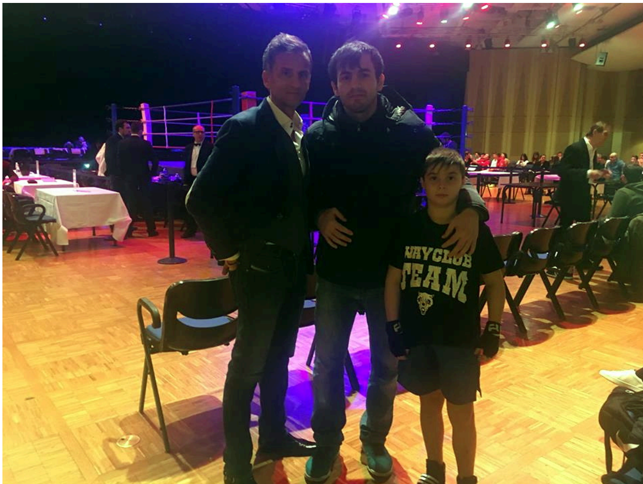
Чемпион Франции Сулиман Абдурашидов