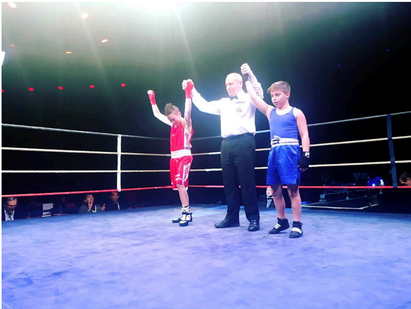
Бой был равным