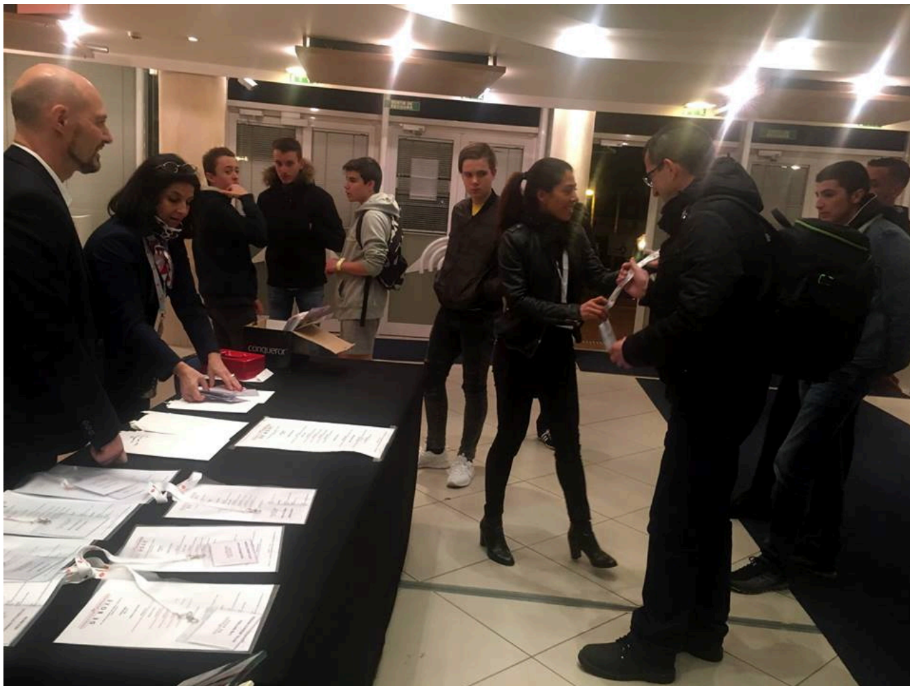
WSPORT-SHATOY получает аккредитацию на турнир