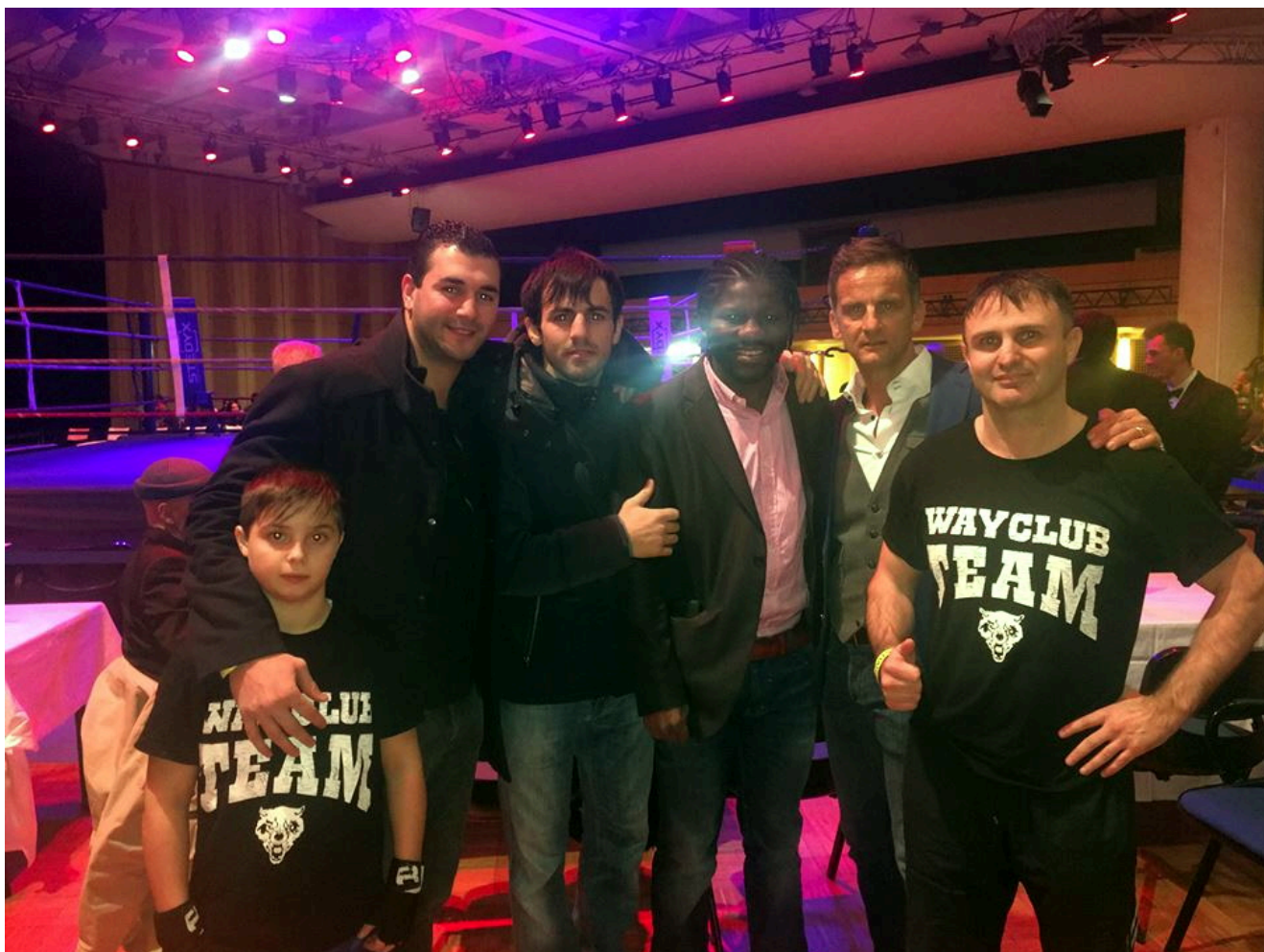
В центре чемпион мира-12 по версии WBO Хассан Н'Дам Н'Жикам.