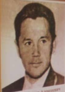
Павел Тихов Александрович

1974-07-14 Сурдлимпийский чемпион в эстафетной гонке. ЧМ СССР, ЧМ СССР, ЧМ СССР. Первый российский спортсмен на зимних ОИП. ЧМ СССР, ЧМ СССР, ЧМ СССР. 1997 стал первым спортсменом-сурдом в составе сборной России в Чехии.